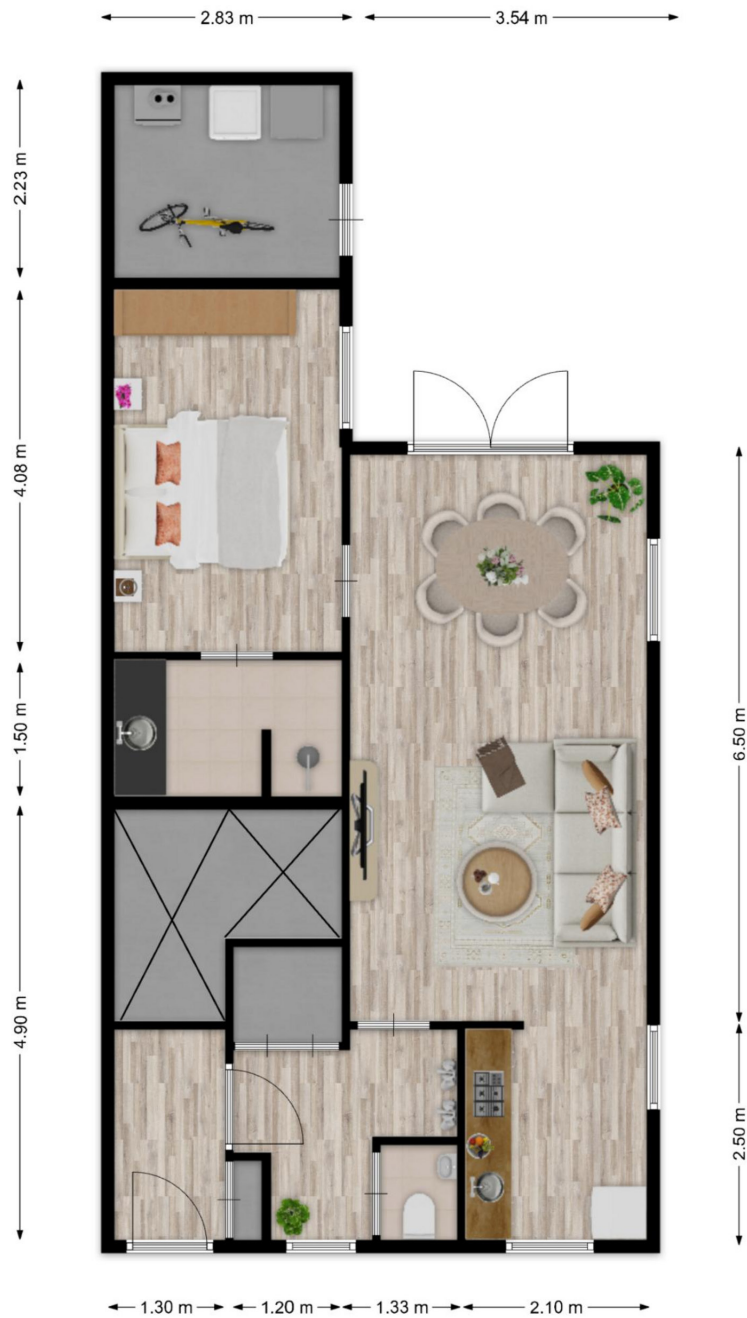
Willibrordusweg 34 te Oss Plattegronden zijn ter indicatie. Aan de maatvoering en indeling kunnen geen rechten worden ontleend

Plattegronden zijn ter illustratie en kunnen op bepaalde punten enigszins afwijken van de werkelijkheid.