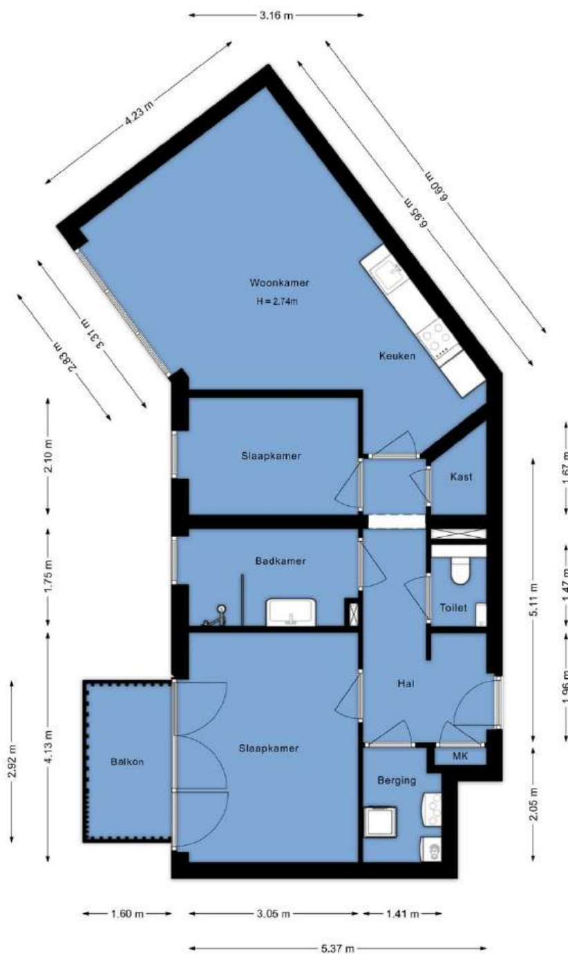
Appartement Niemeyerstraat 38 Hoofddorp