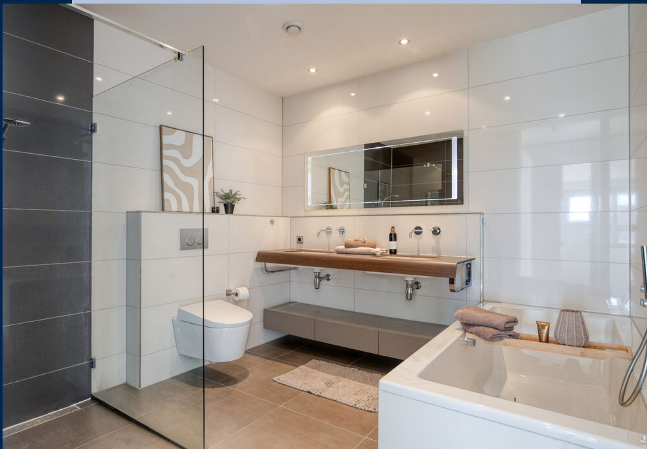
De luxe en vergrote badkamer is modern uitgevoerd en voorzien van een ligbad, ruime inloofdouche, zwevend Geberit toilet en een dubbel wastafelmeubel.