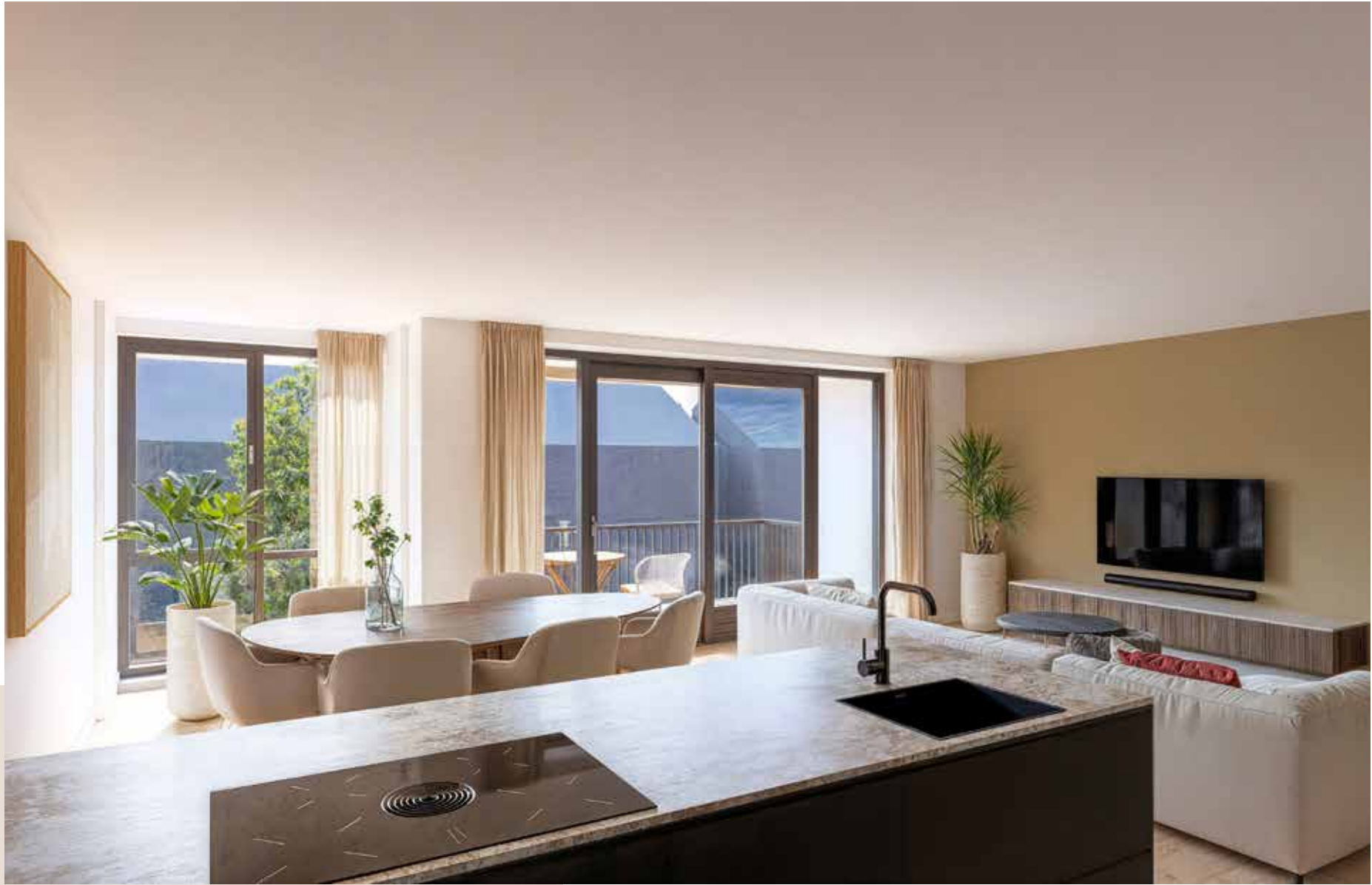
Impressie Type C