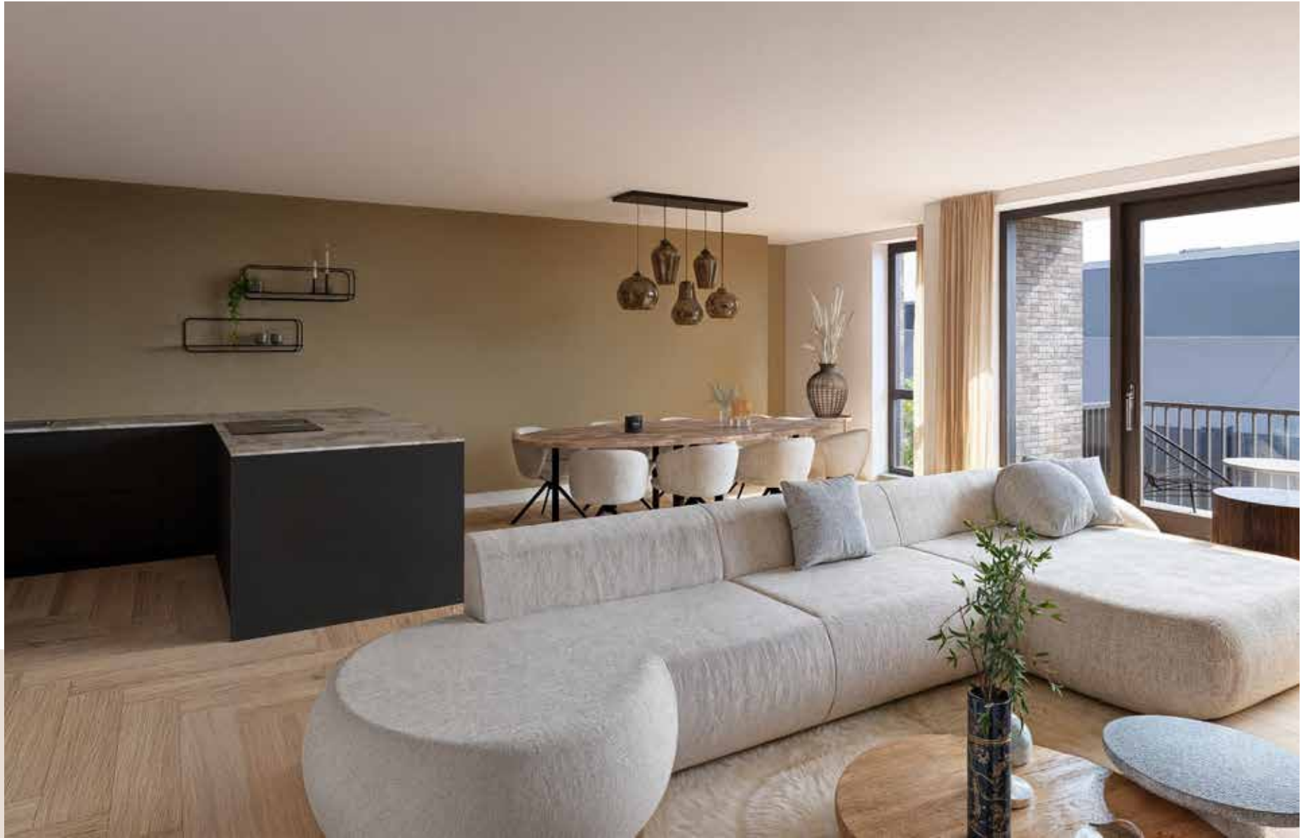
Impressie Type F