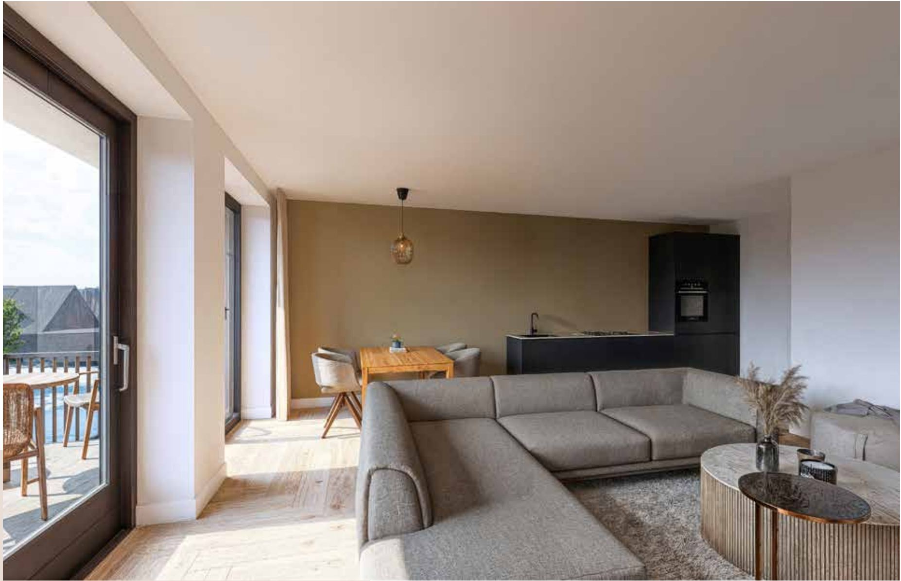
Impressie Type D