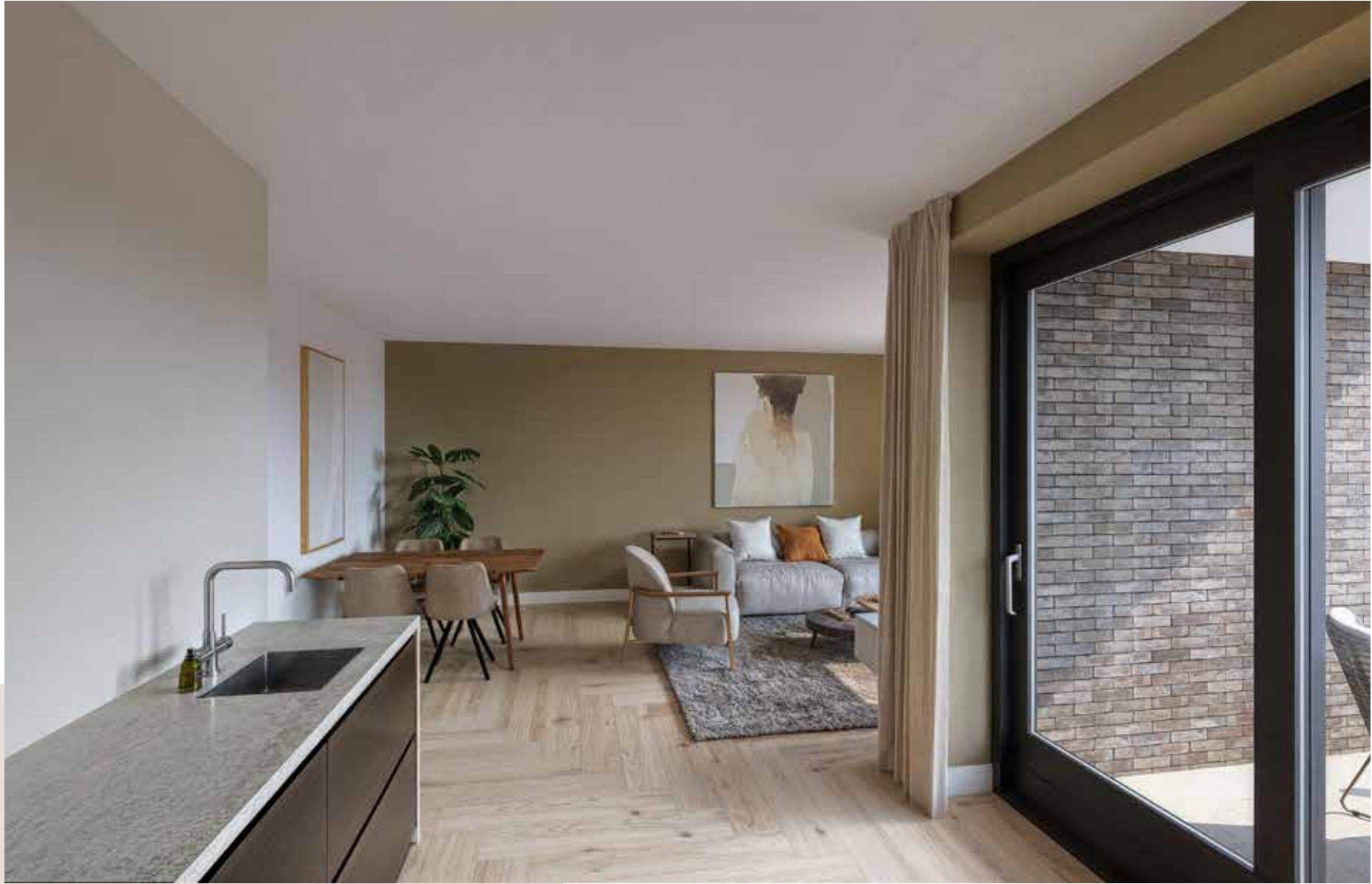
Impressie Type E