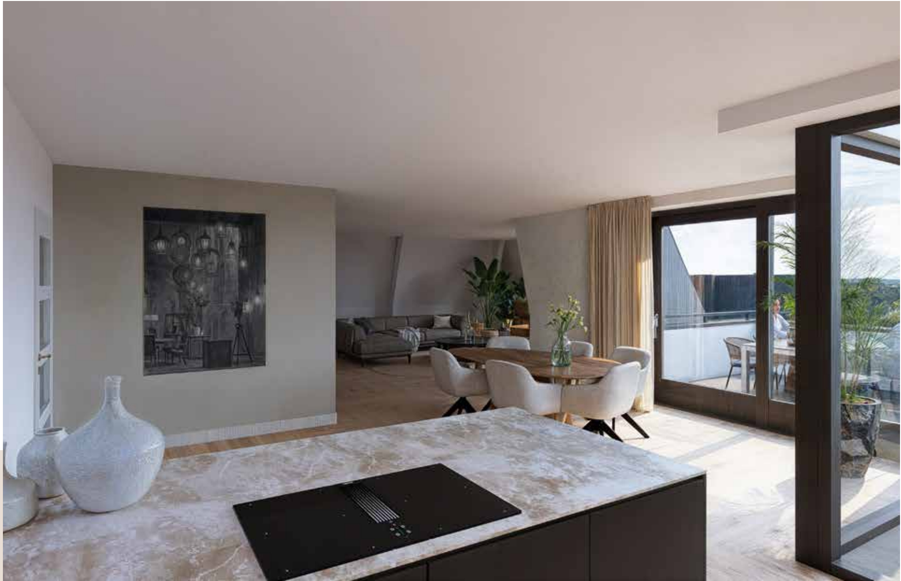
Impressie Type H