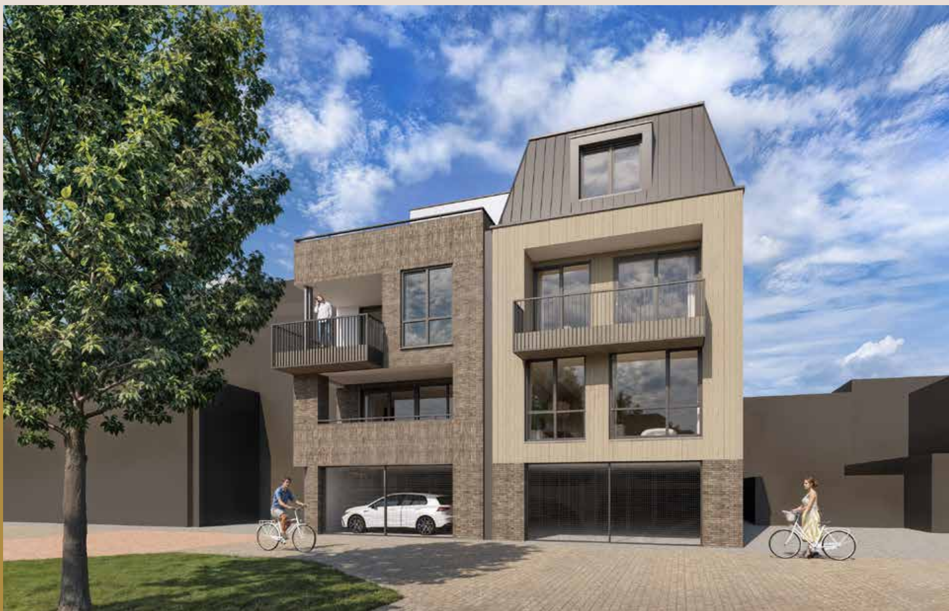
Aanzicht van de achtergevel.