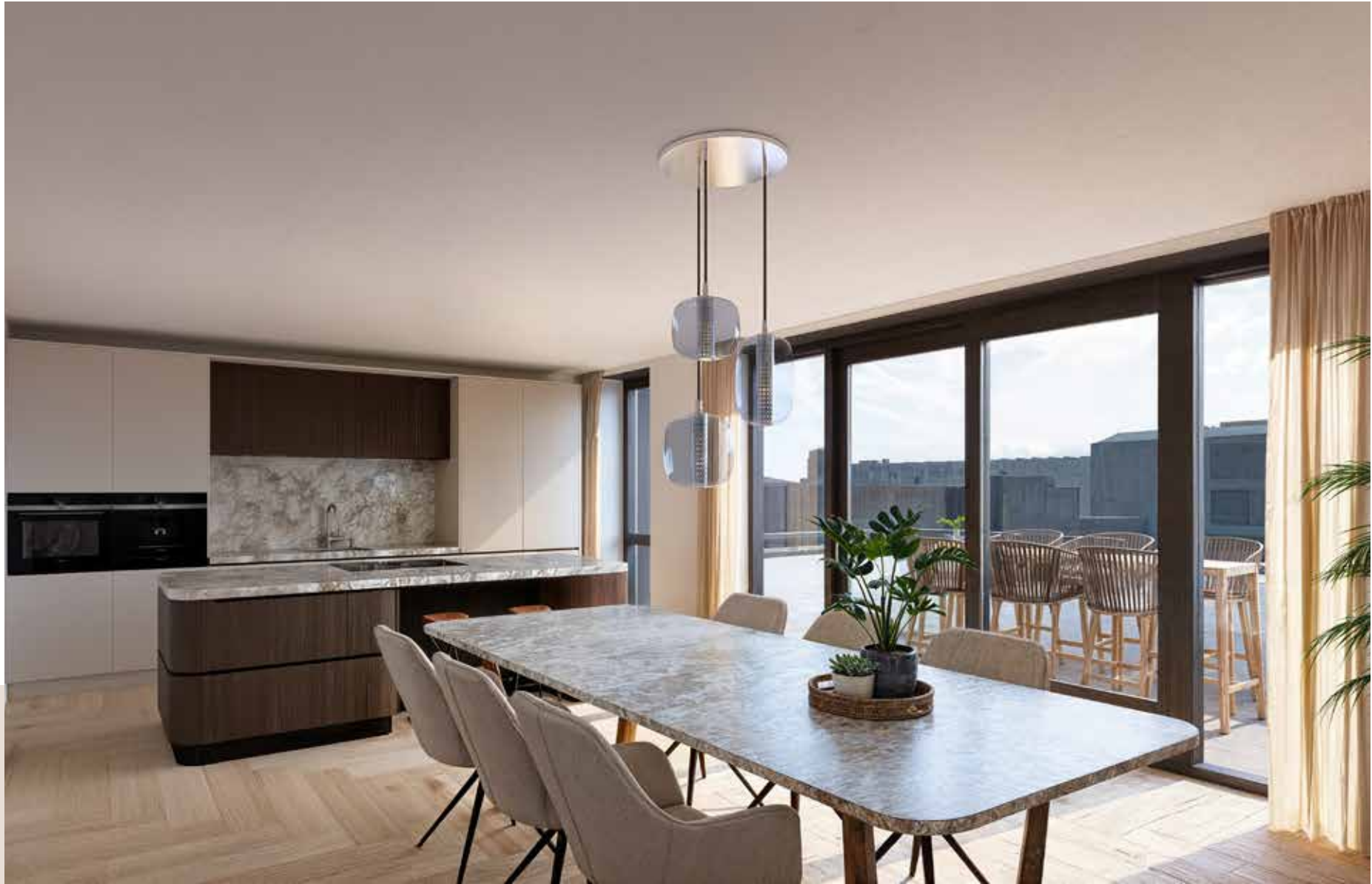
Impressie Type I