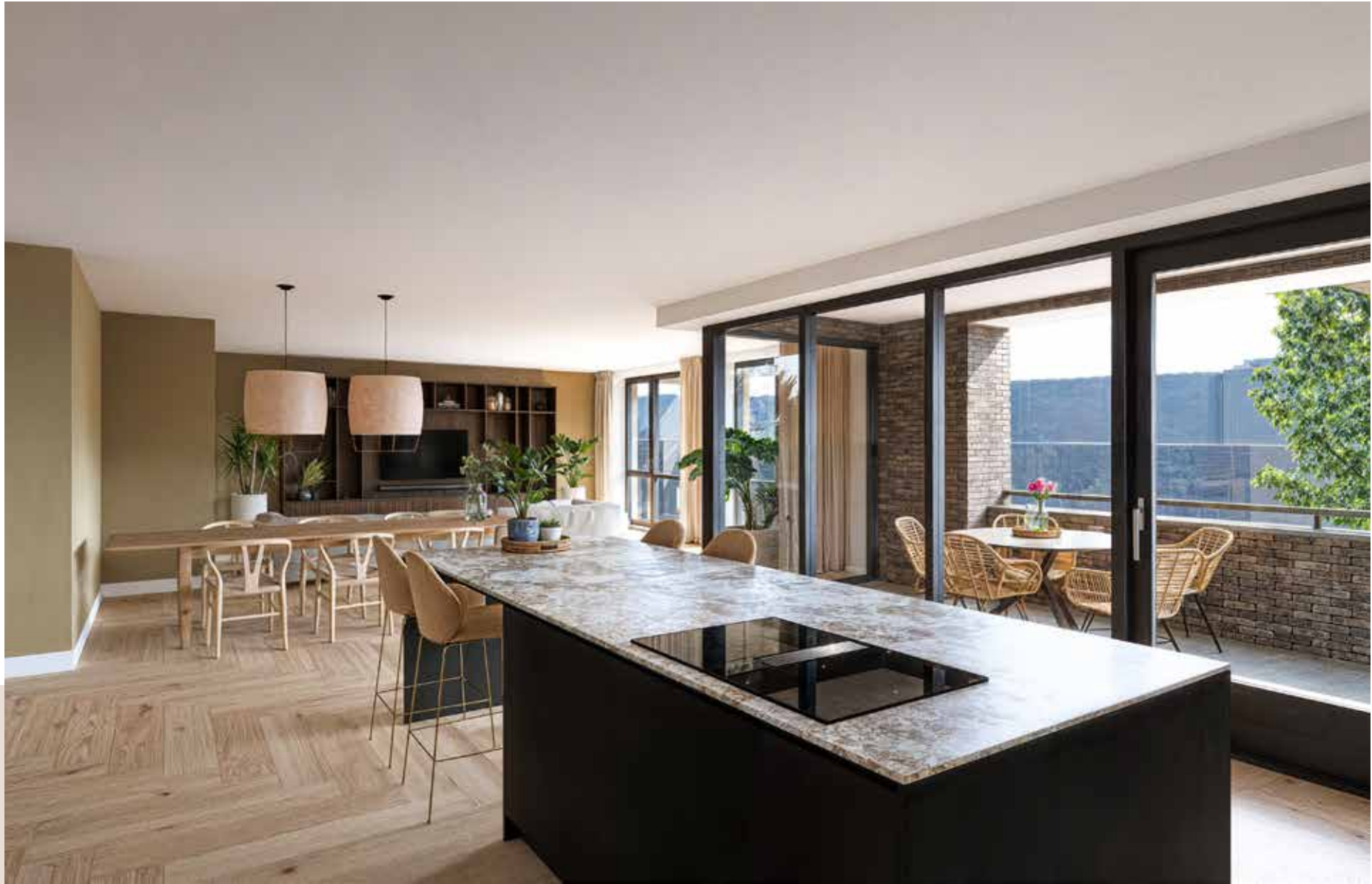
Impressie Type A