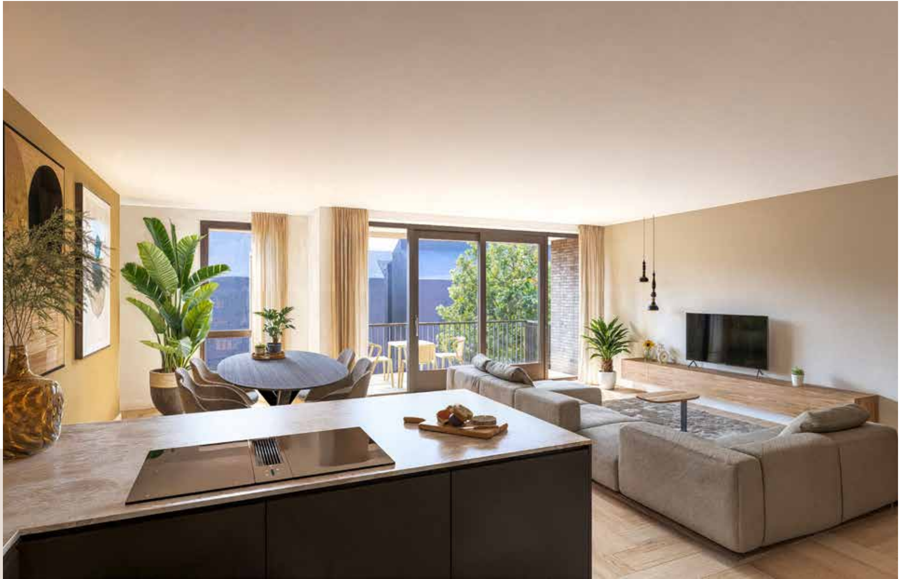
Impressie Type B