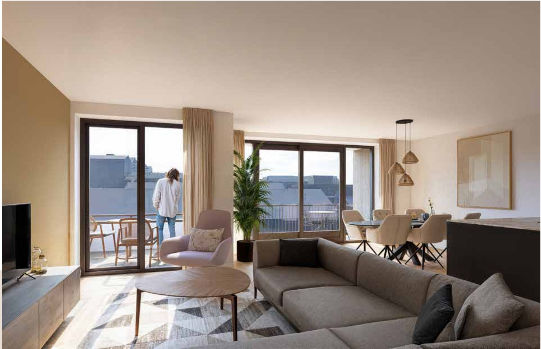
Impressie Type G