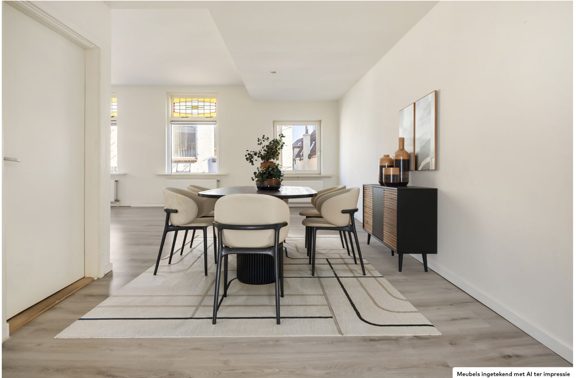
Meubels ingetekend met AI ter impressie