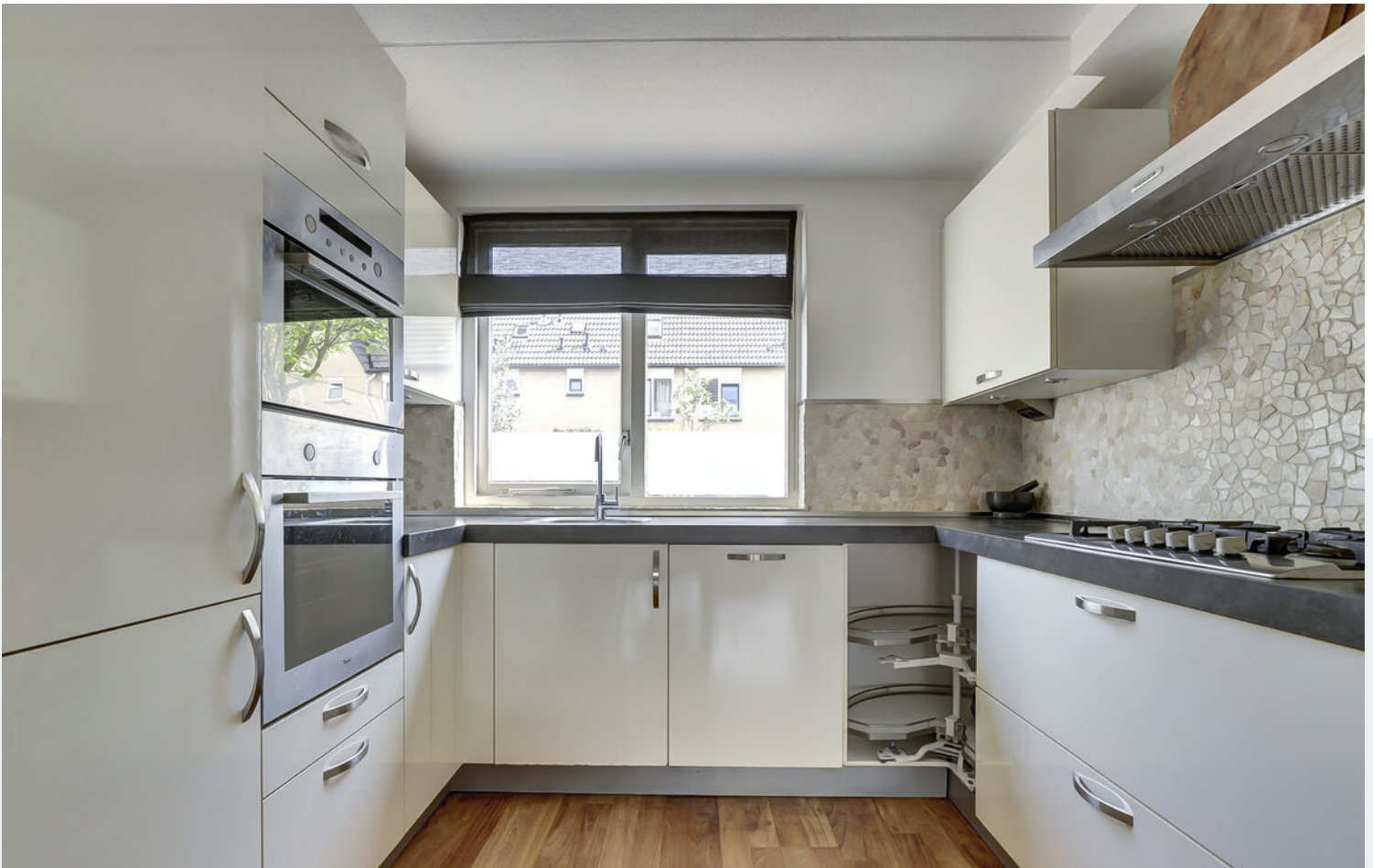
Entree, hal, toilet en keuken