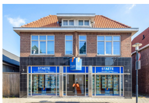
Waalwijk Grotestraat 365 0416 - 344 944 infowaalwijk@staete.nl