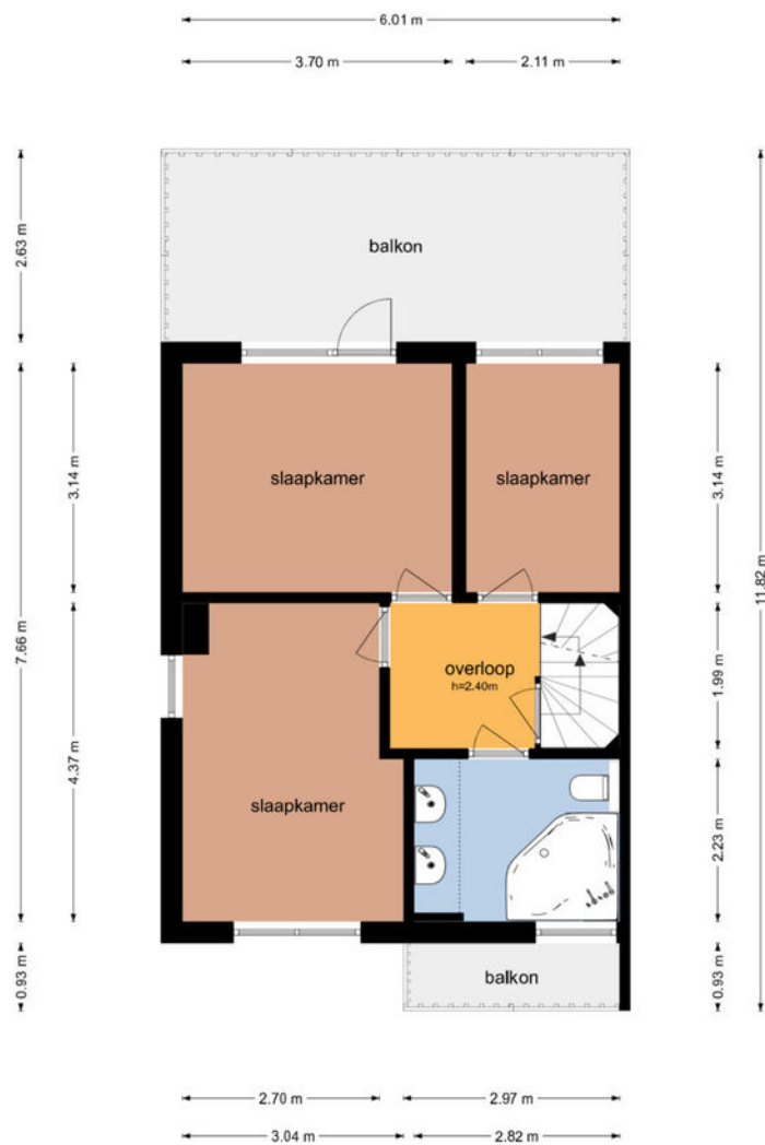
Marijkestraat 12 - Culemborg Eerste Verdieping

De plattegronden zijn geproduceerd voor promotionele doeleinden en ter indicatie. Aan de plattegronden kunnen geen rechten worden ontleend.