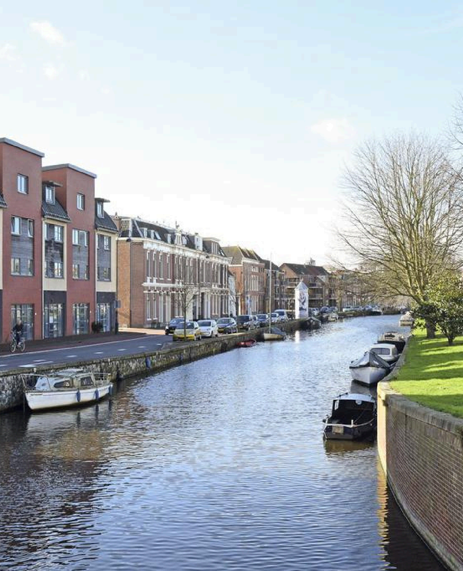
Petrus Planciusstraat 12, Haarlem