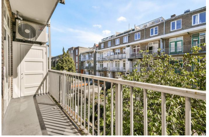
Tweede Schinkelstraat 51 2, 1075 TR Amsterdam