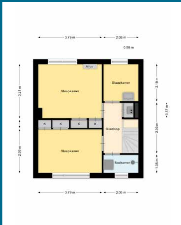
Indeling 1 ste verdieping