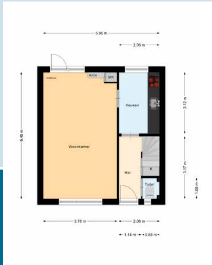
Indeling begane grond