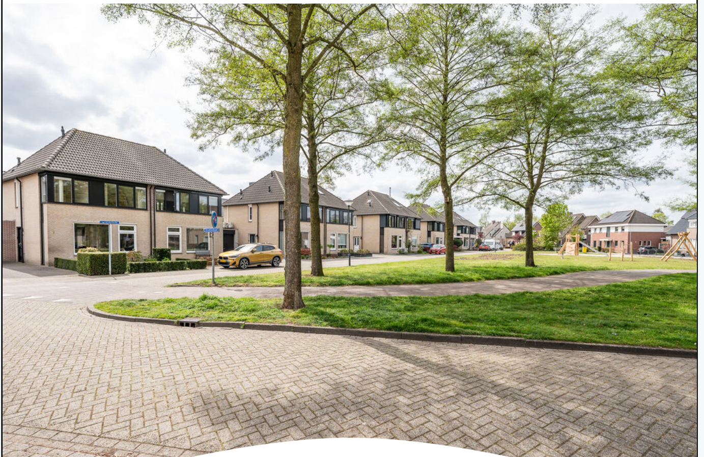
LAVENDELHEIDE 1 HELMOND