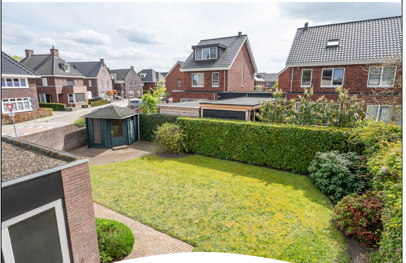
LAVENDELHEIDE 1 HELMOND