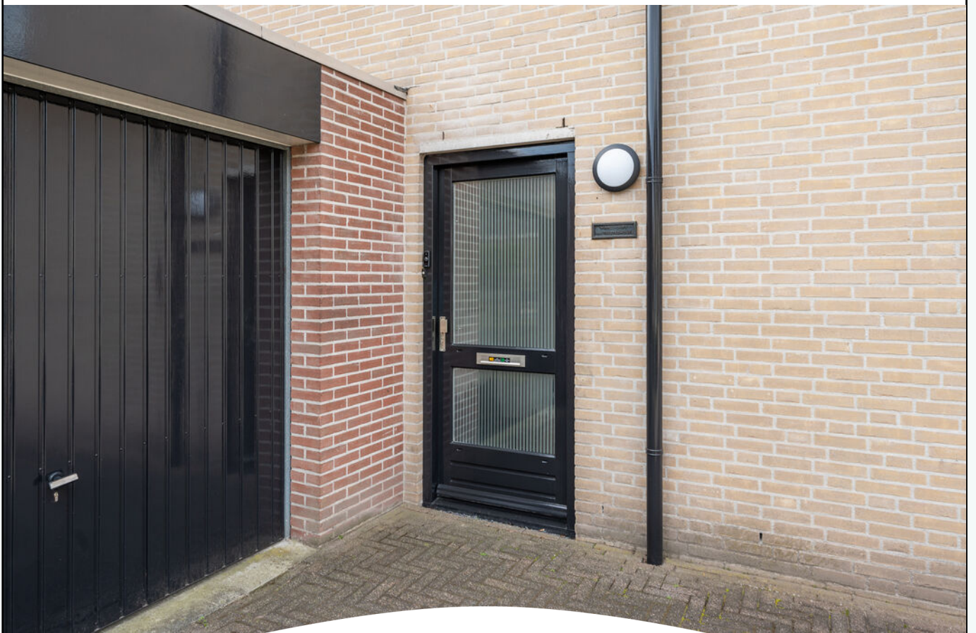
LAVENDELHEIDE 1 HELMOND