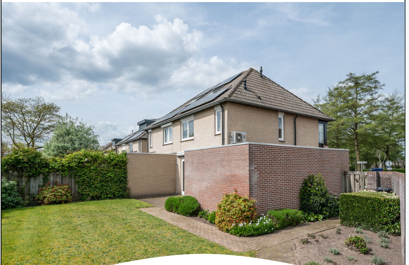
LAVENDELHEIDE 1 HELMOND