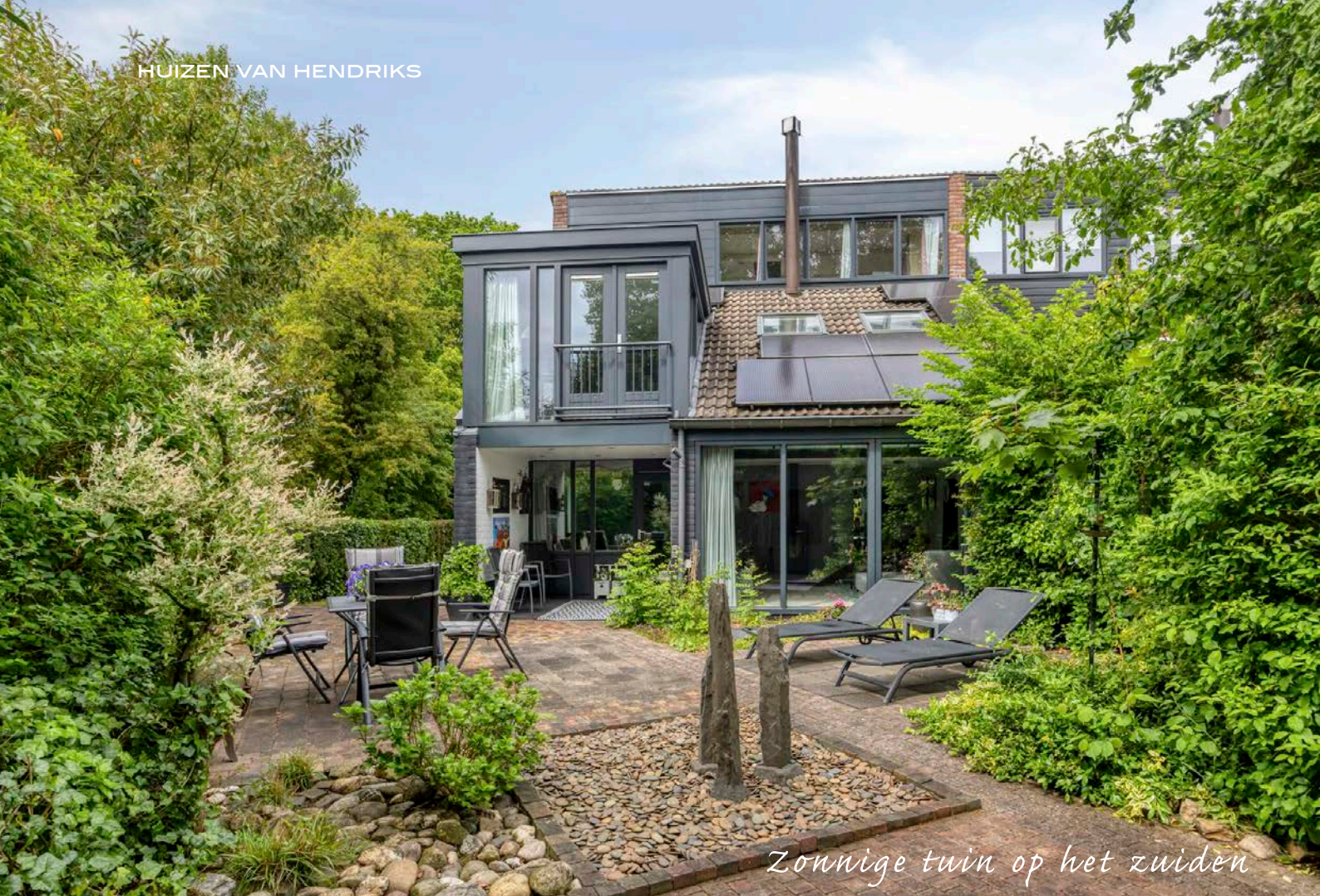
Zonnige tuin op het zuiden