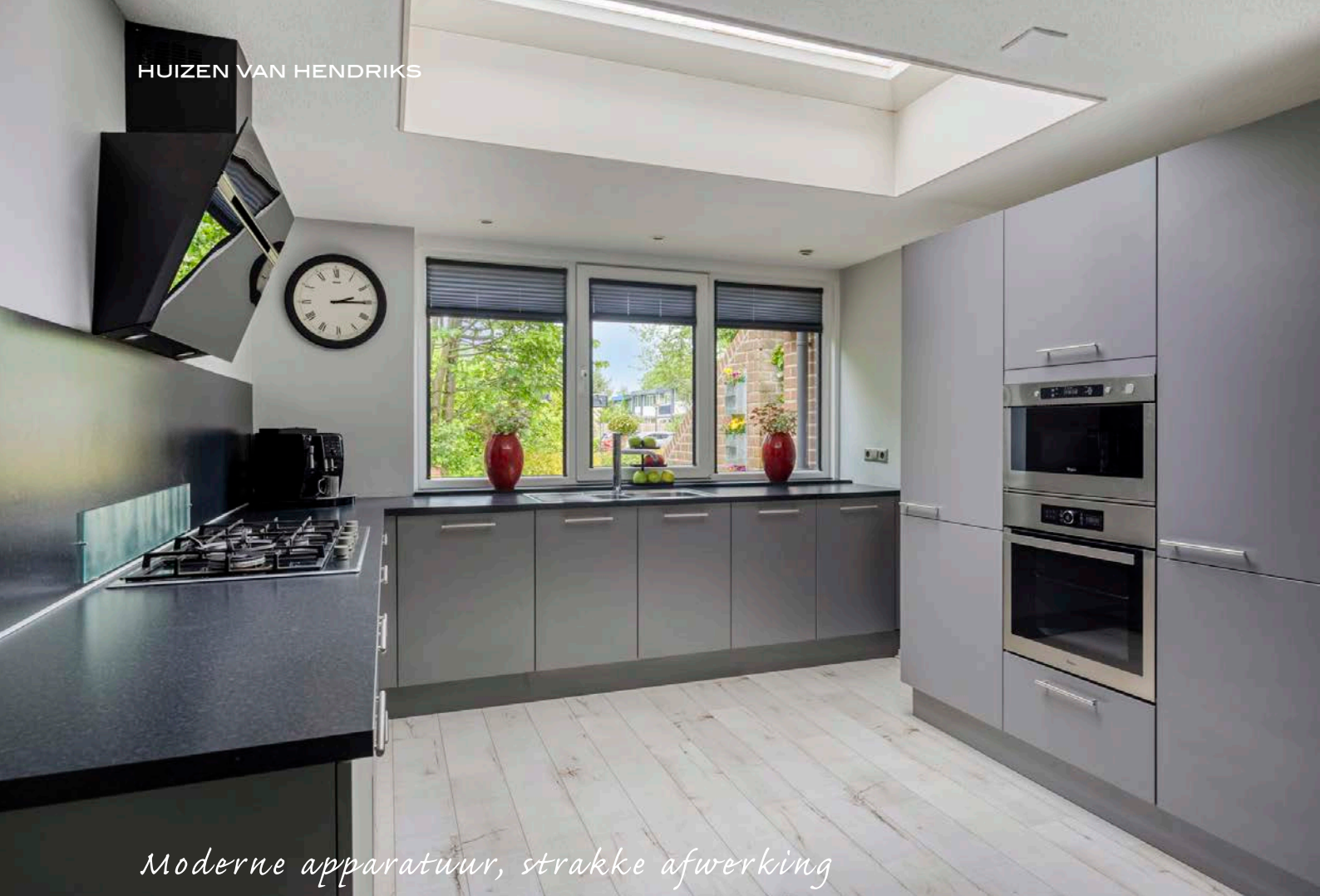
Moderne apparatuur, strakke afwerking