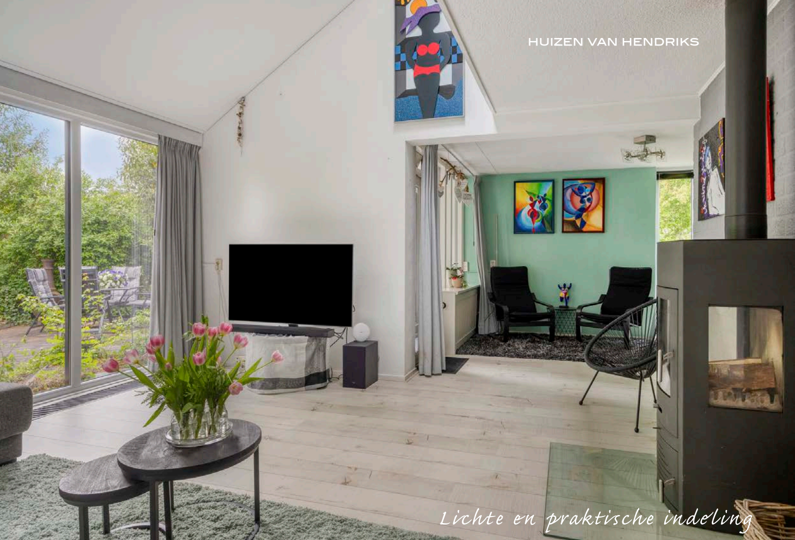
Lichte en praktische indeling