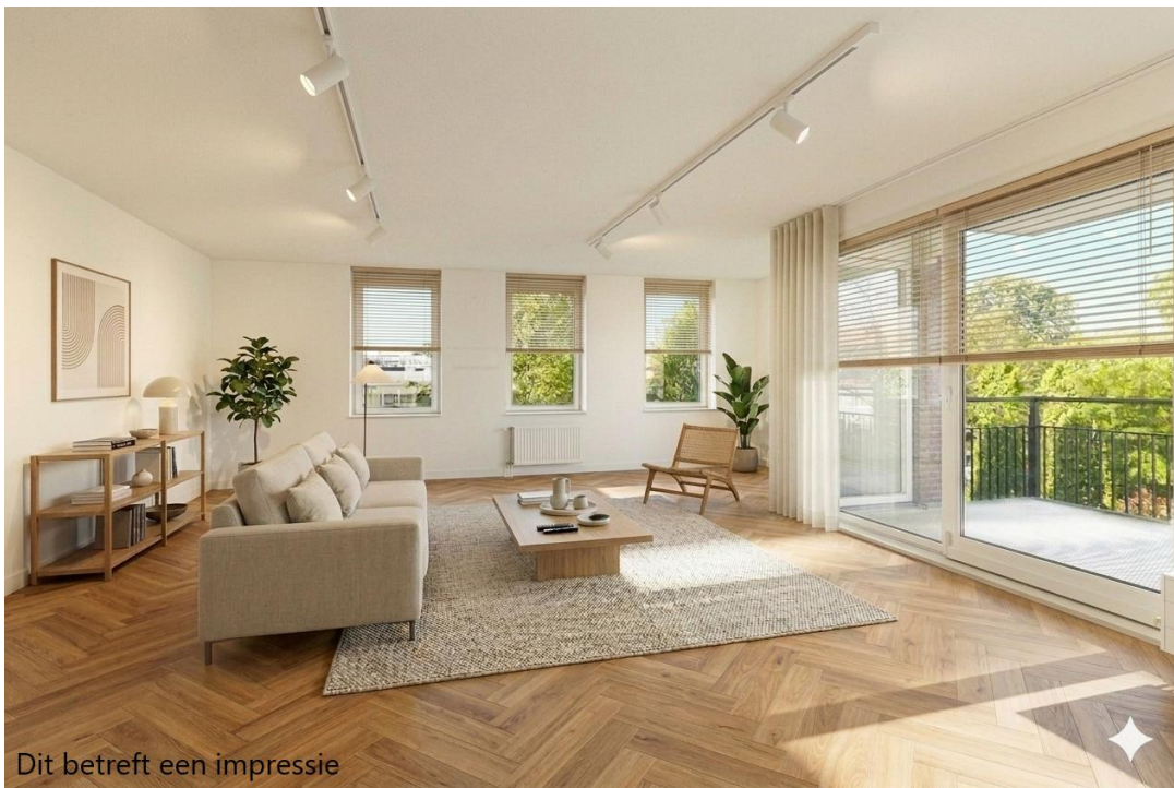
Dit betreft een impressie