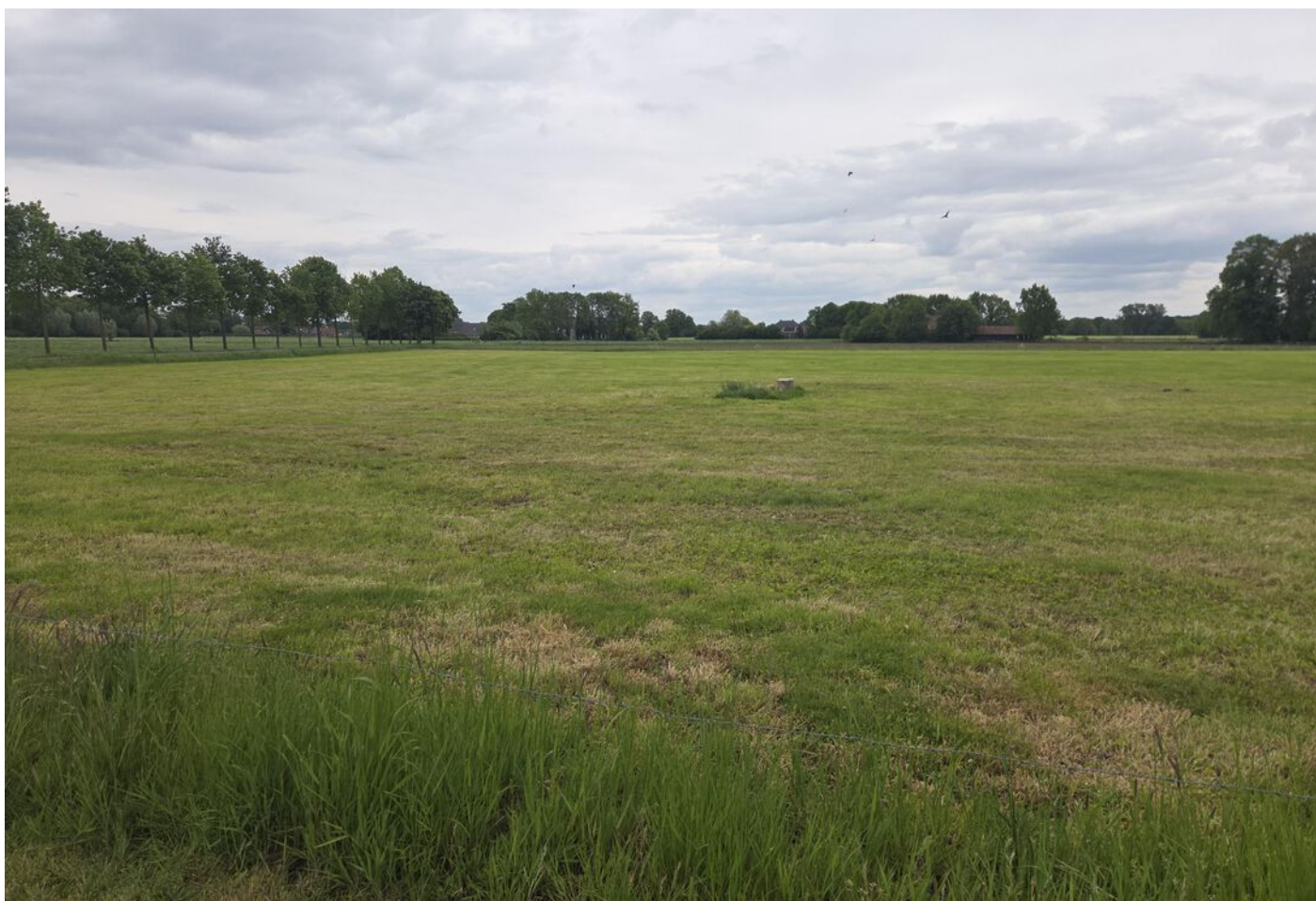
Nijmansdijk bij nr 18 De Heurne