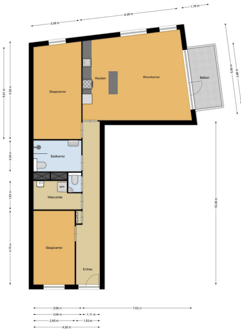
Duiker 59, Huizen

De plattegronden zijn geproduceerd voor promotionele doeleinden en ter indicatie. Aan de plattegronden kunnen geen rechten worden ontleend.