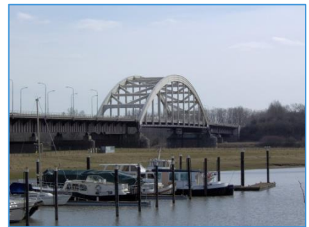
Prinses Irene Brigade Brug