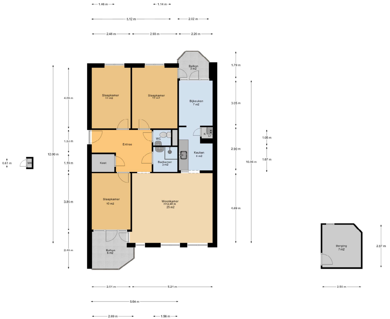
Appartement + Berging