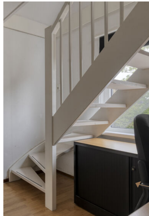
Vaste trap naar de tweede verdieping