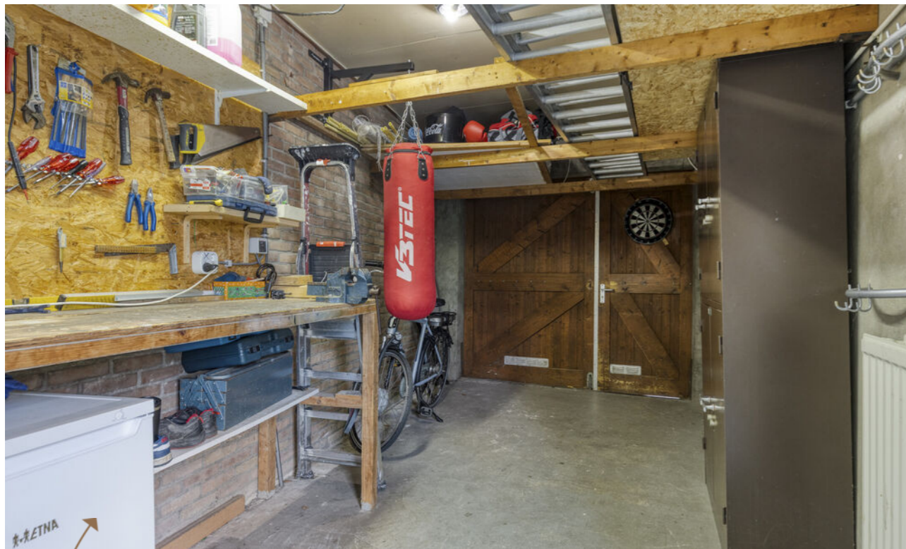
Veel praktische opbergruimte