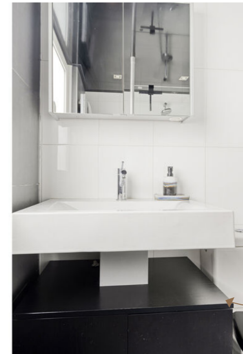
De badkamer is voorzien van een douche, wastafel en toilet