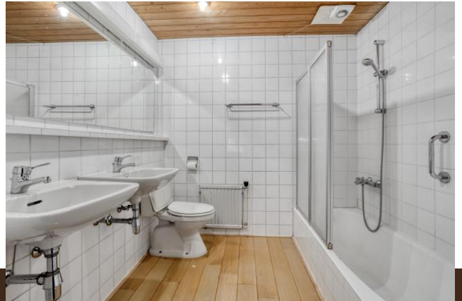
Brugstraat 1 Baambrugge