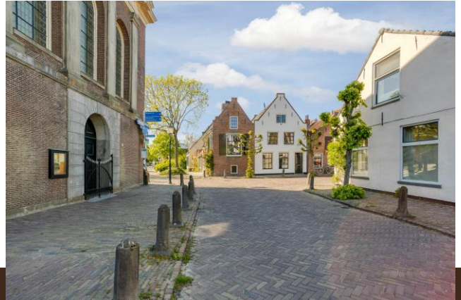
Brugstraat 1 Baambrugge