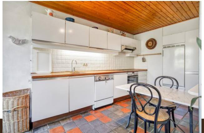
Brugstraat 1 Baambrugge