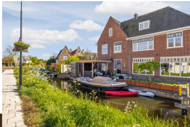
Brugstraat 1 Baambrugge