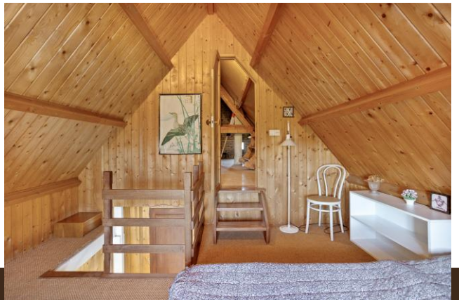
Brugstraat 1 Baambrugge