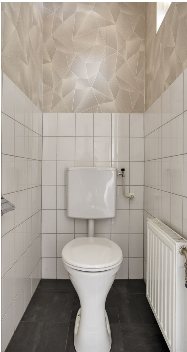
De toiletruimte is uitgerust met een eenvoudig staand toilet