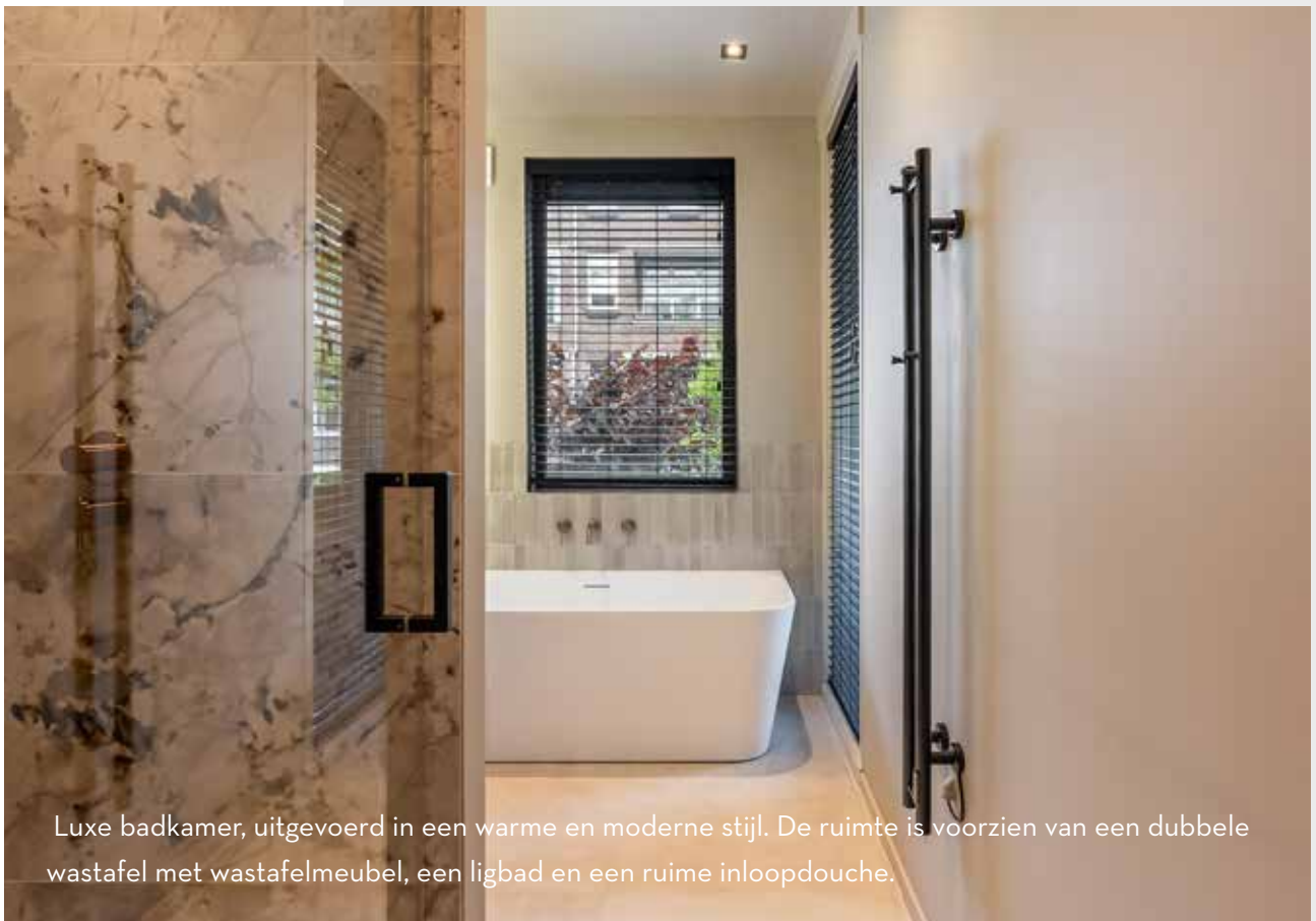
Luxe badkamer, uitgevoerd in een warme en moderne stijl. De ruimte is voorzien van een dubbele wastafel met wastafelmeubel, een ligbad en een ruime inloopdouche.