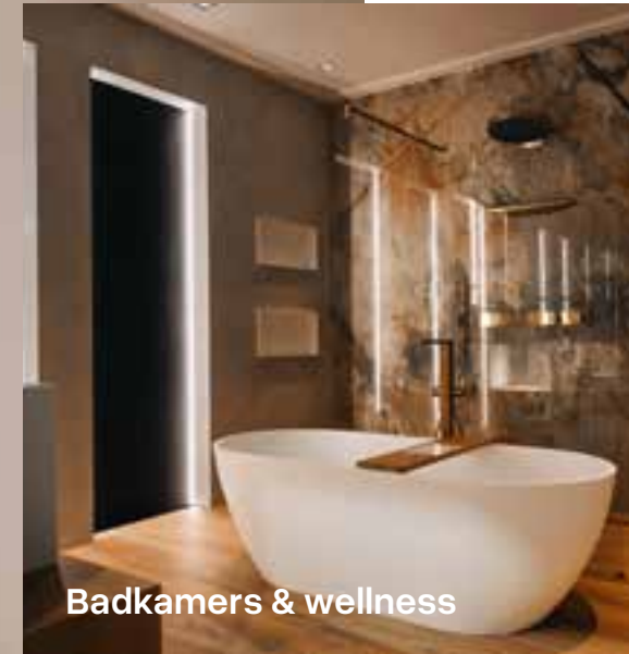
Badkamers & wellness