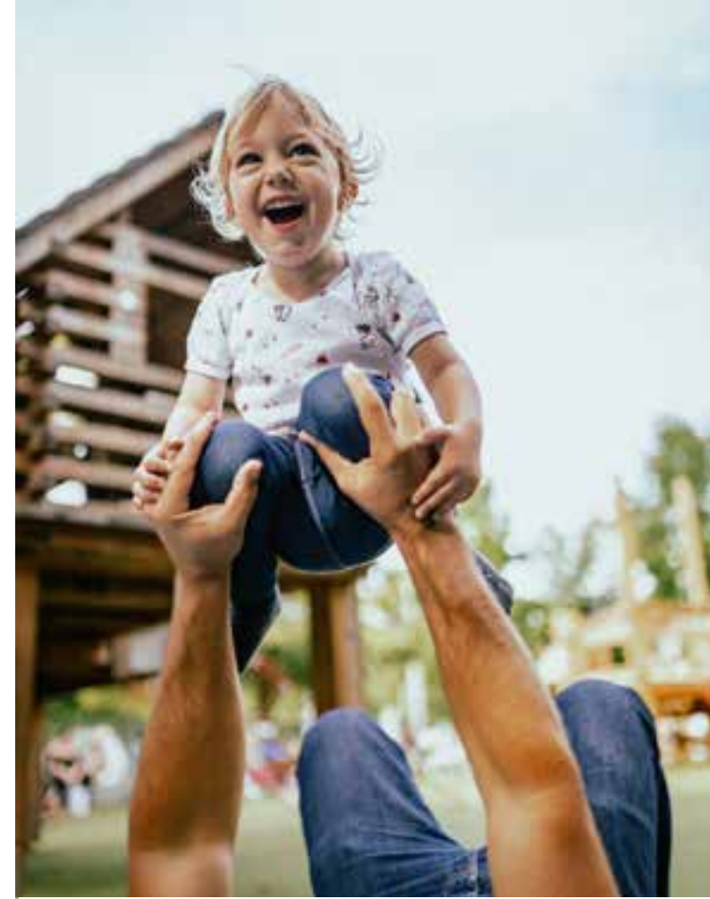
Iedere dag het ultieme vakantiegevoel