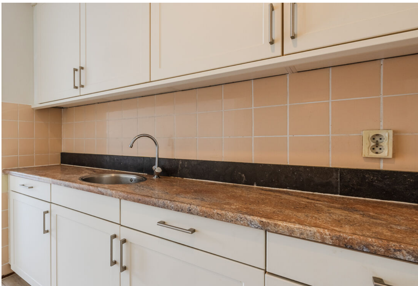
Hasebroekstraat 9, Leiden