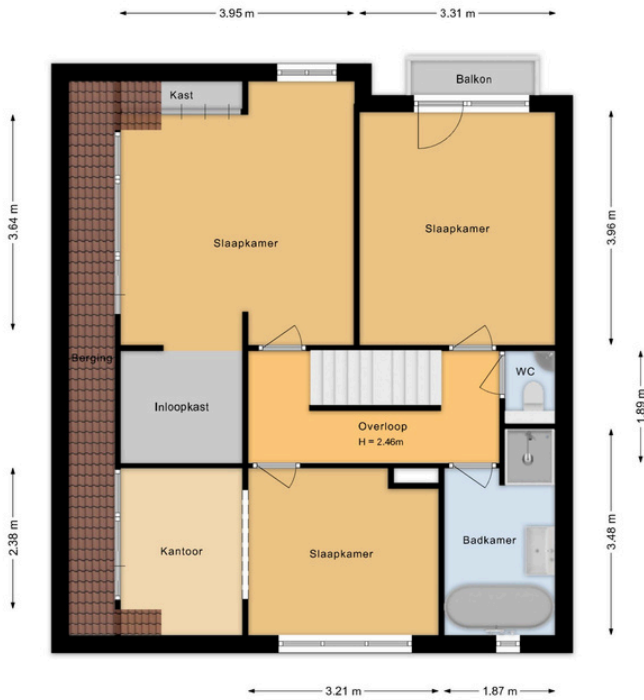
Grevelingen 40 Heemstede 1e Verdieping

Deze plattegrond is met de grootst mogelijke zorg samengesteld. Desondanks kunnen er geen rechten aan worden ontleend en kunnen er kleine afwijking zijn in de exacte maatvoering. www.agvastgoedmedia.nl