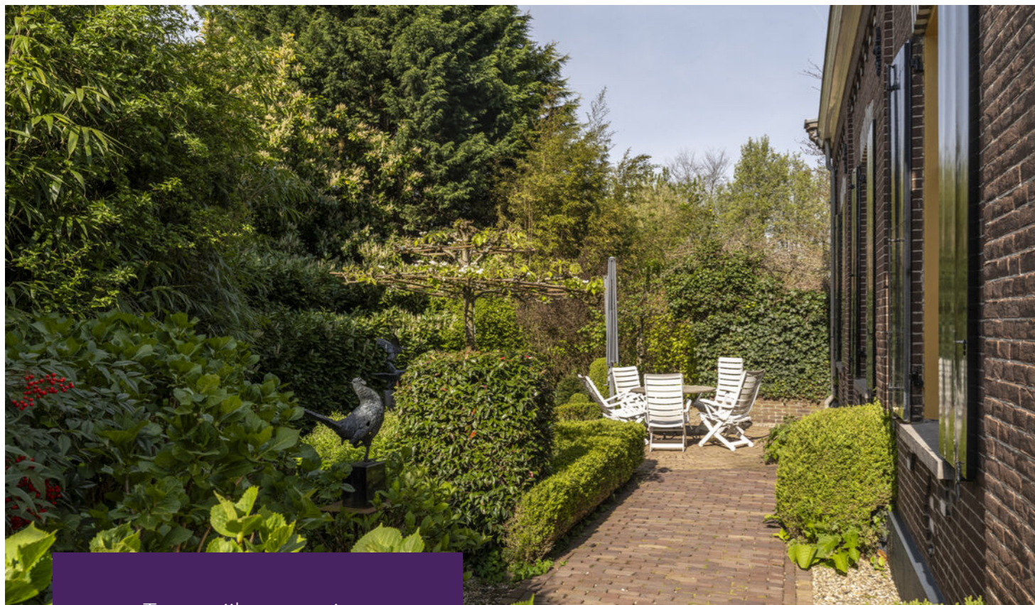
Terras zijkant woning Carport