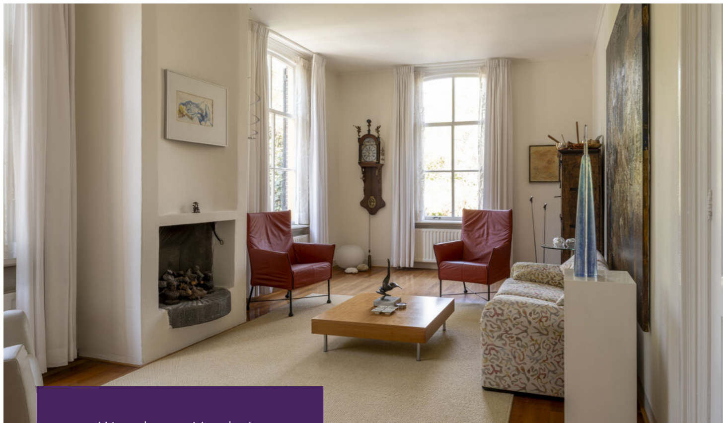
Woonkamer Voorhuis Kantoorruimte