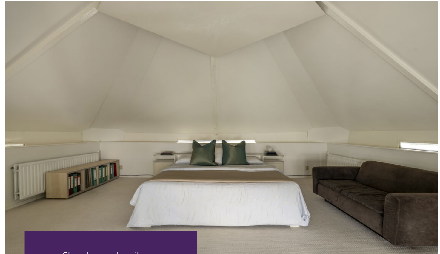
Slaapkamer hooiberg Pantry en douche