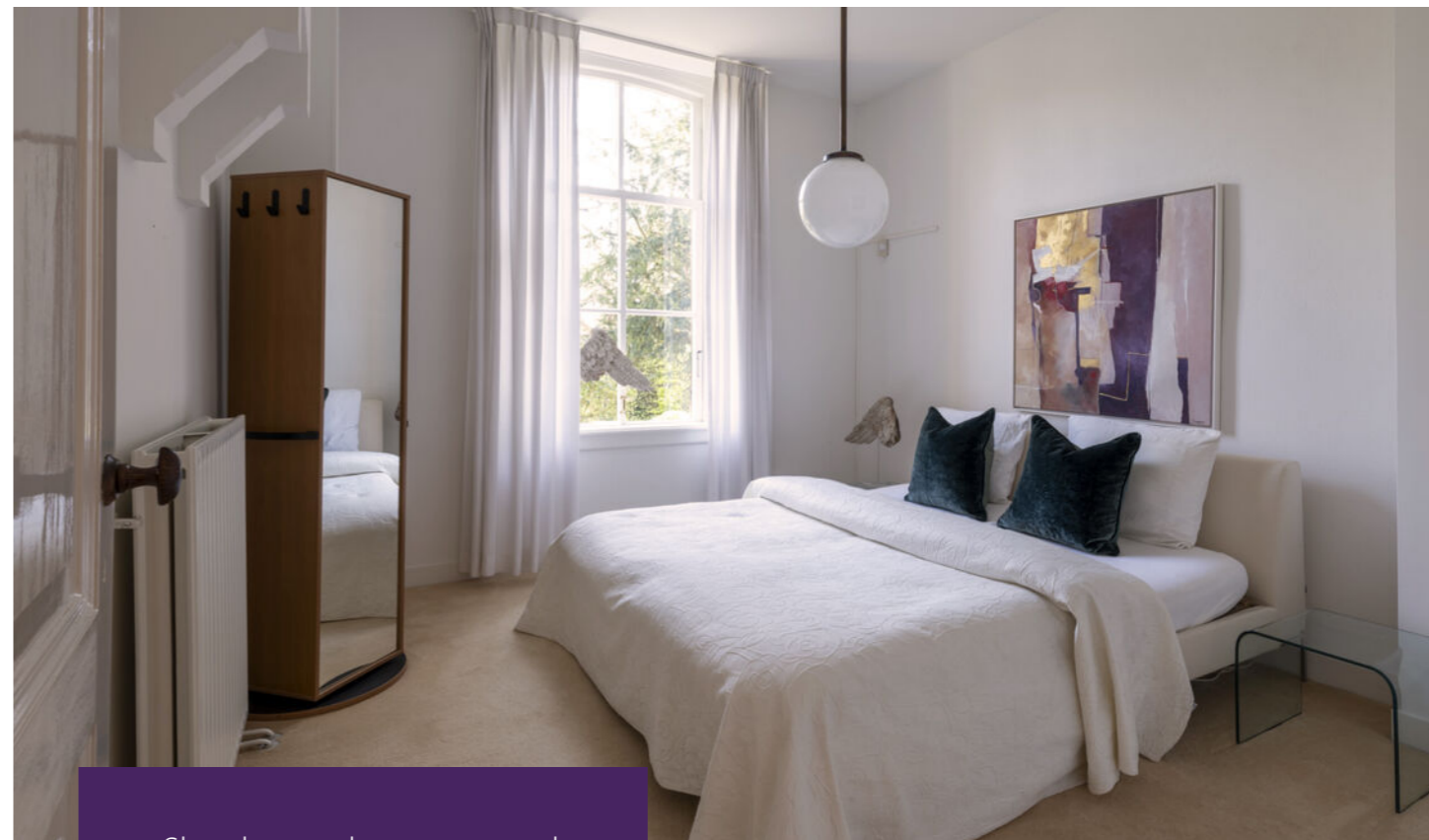
Slaapkamer begane grond Toilet