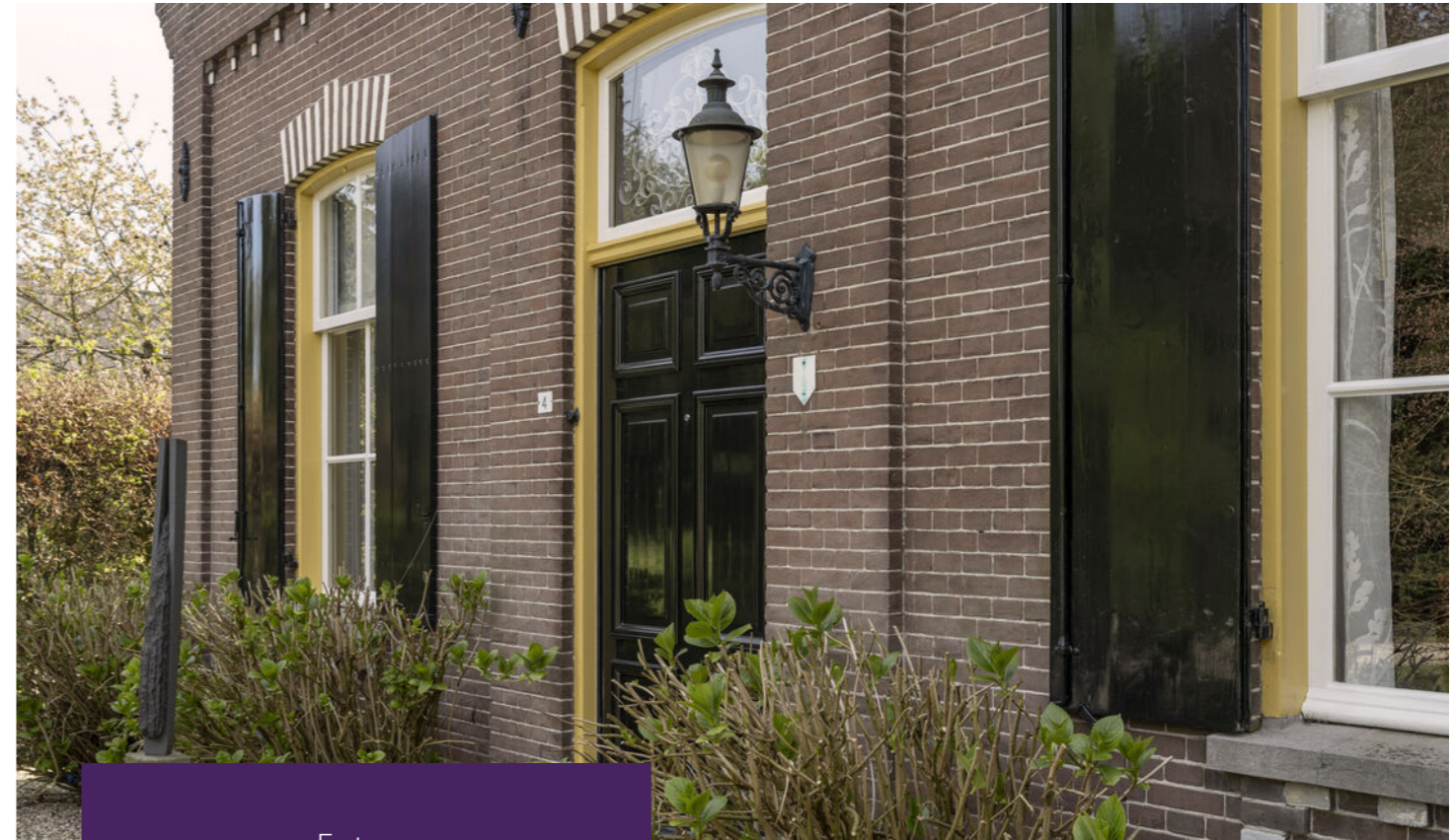
Entree Oprijlaan zijkant woning