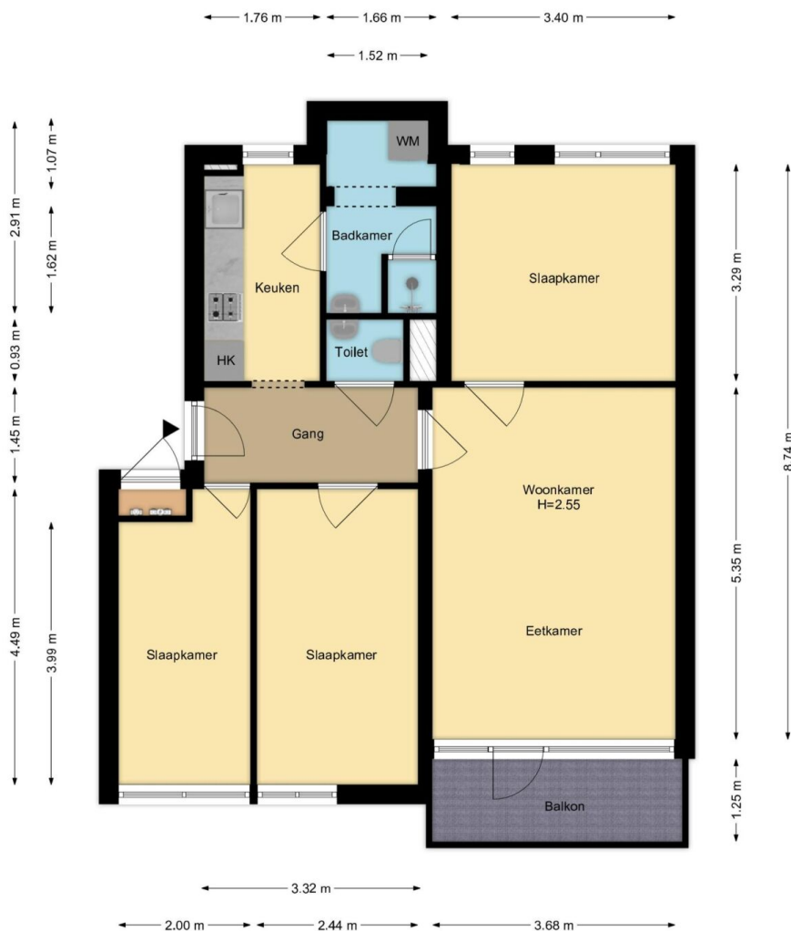
Appartement Populierenlaan 139, Zwanenburg R.M. Vastgoedpresentatie| Aan deze plattegrond kunnen geen rechten worden ontleend