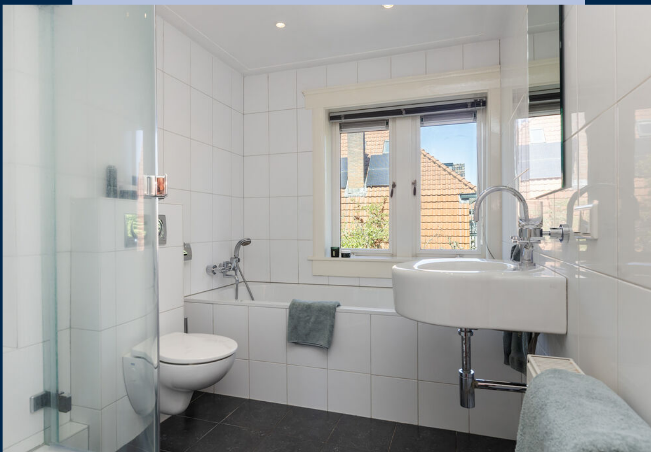
De badkamer is v.v. een ligbad, douche, wastafel en toilet.