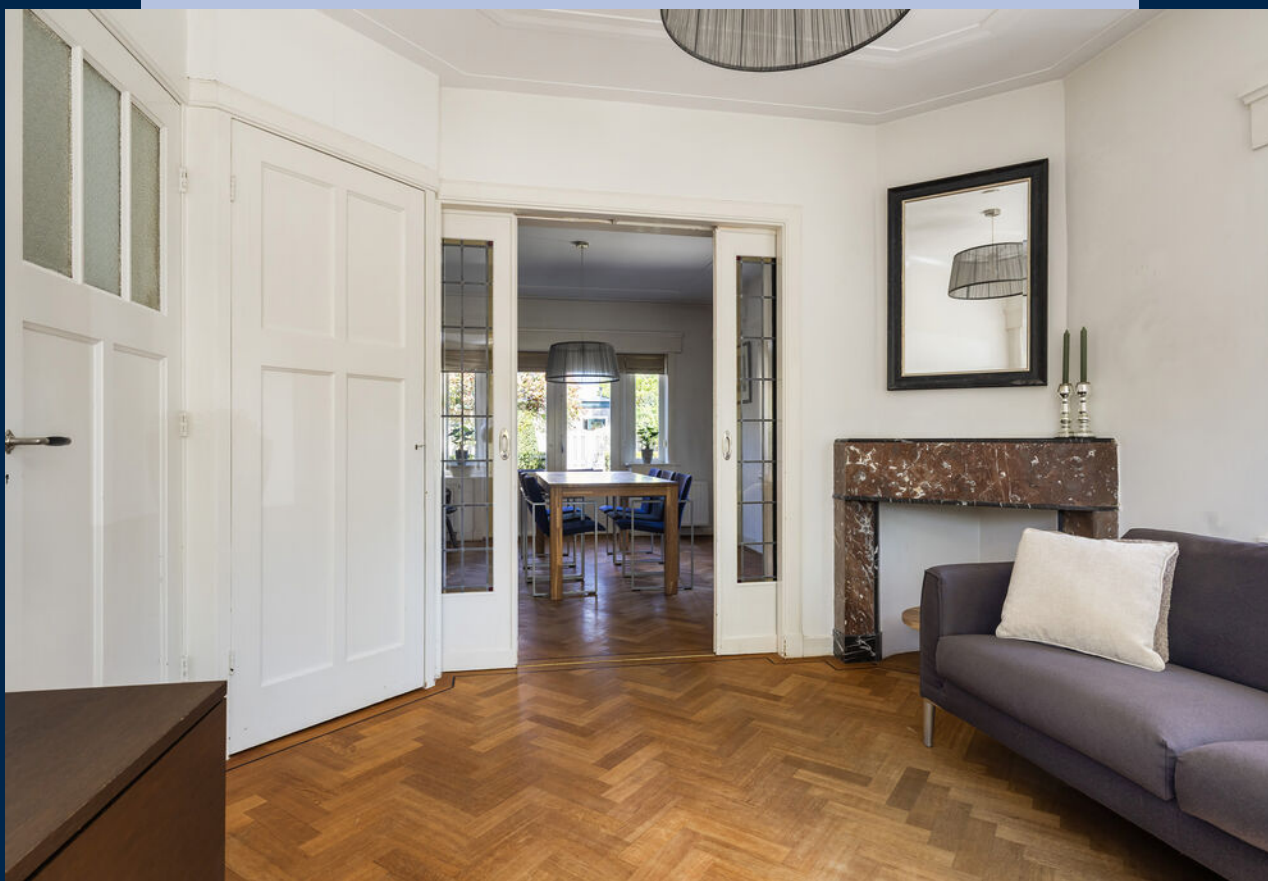
De woonkamer met parketvloer is licht en ruim van opzet en beschikt over een karakteristieke erker, wat zorgt voor extra lichtinval.