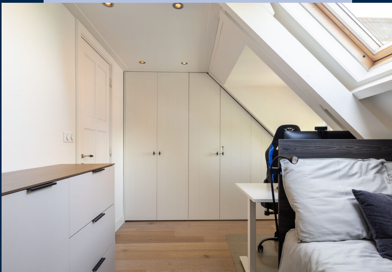
De vierde slaapkamer beschikt over een dakkapel, Velux dakraam en ruime inbouwkast.