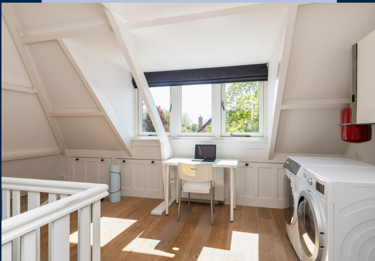
Via vaste trap bereikbare ruime lichte voorzolder met wastafel en aansluiting wasapparatuur alsmede via een luik toegang naar een kleine bergzolder.