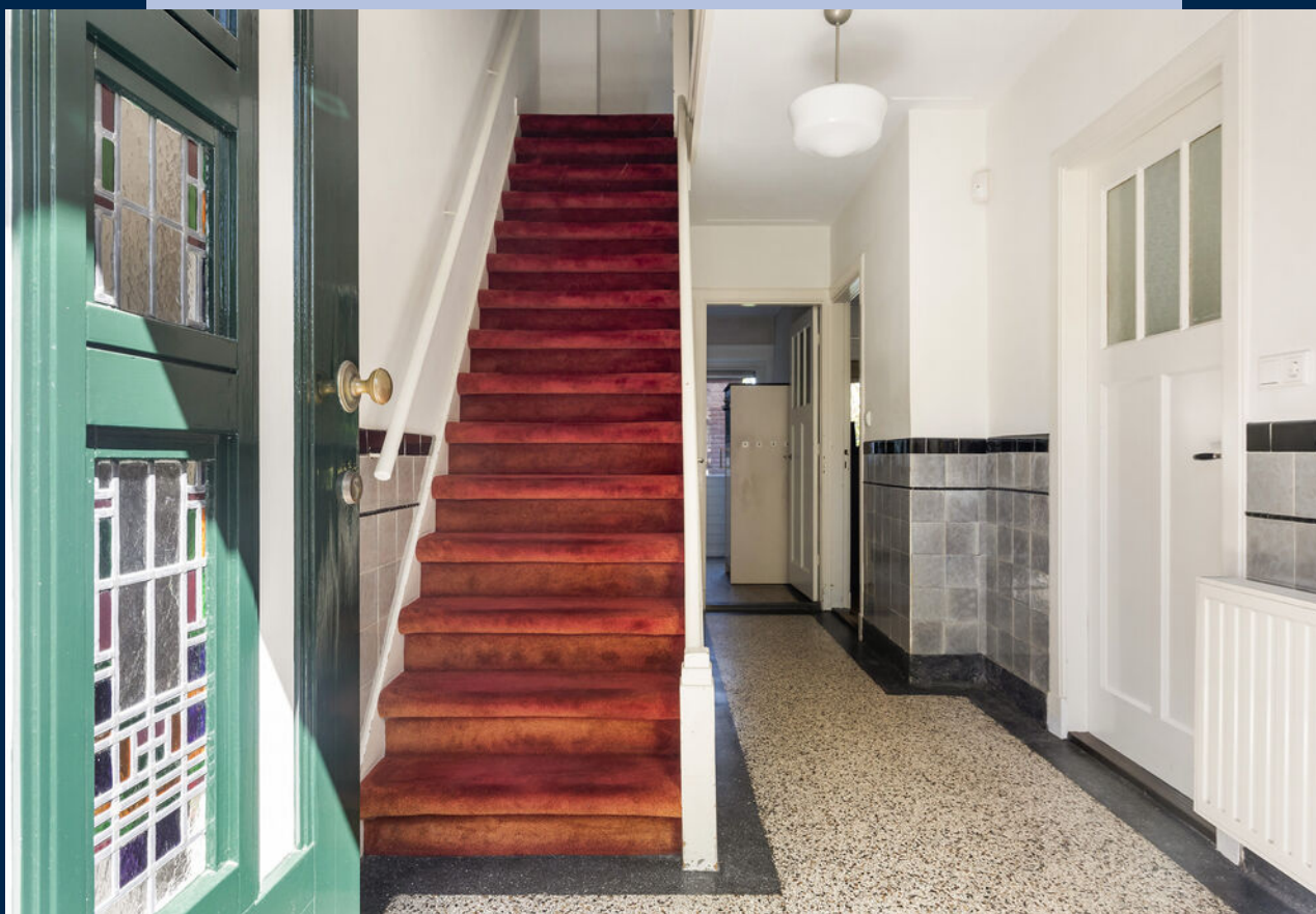
Entree/hal met meterkast, verdiepte trapkast, betegeld toilet met fontein, garderoberuimte met originele granitvloer.