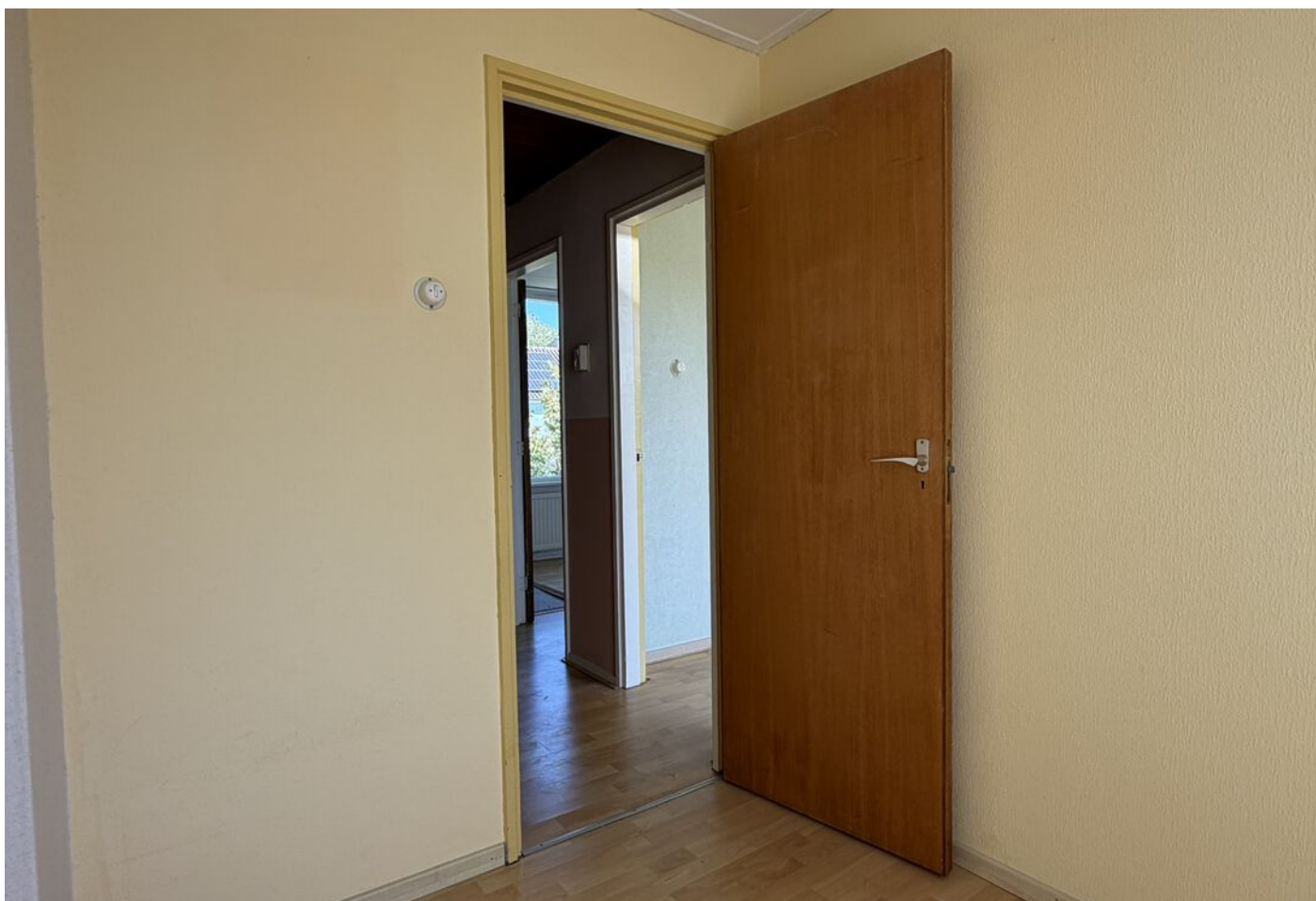
Oranje Nassaustraat 28, Bovenkarspel