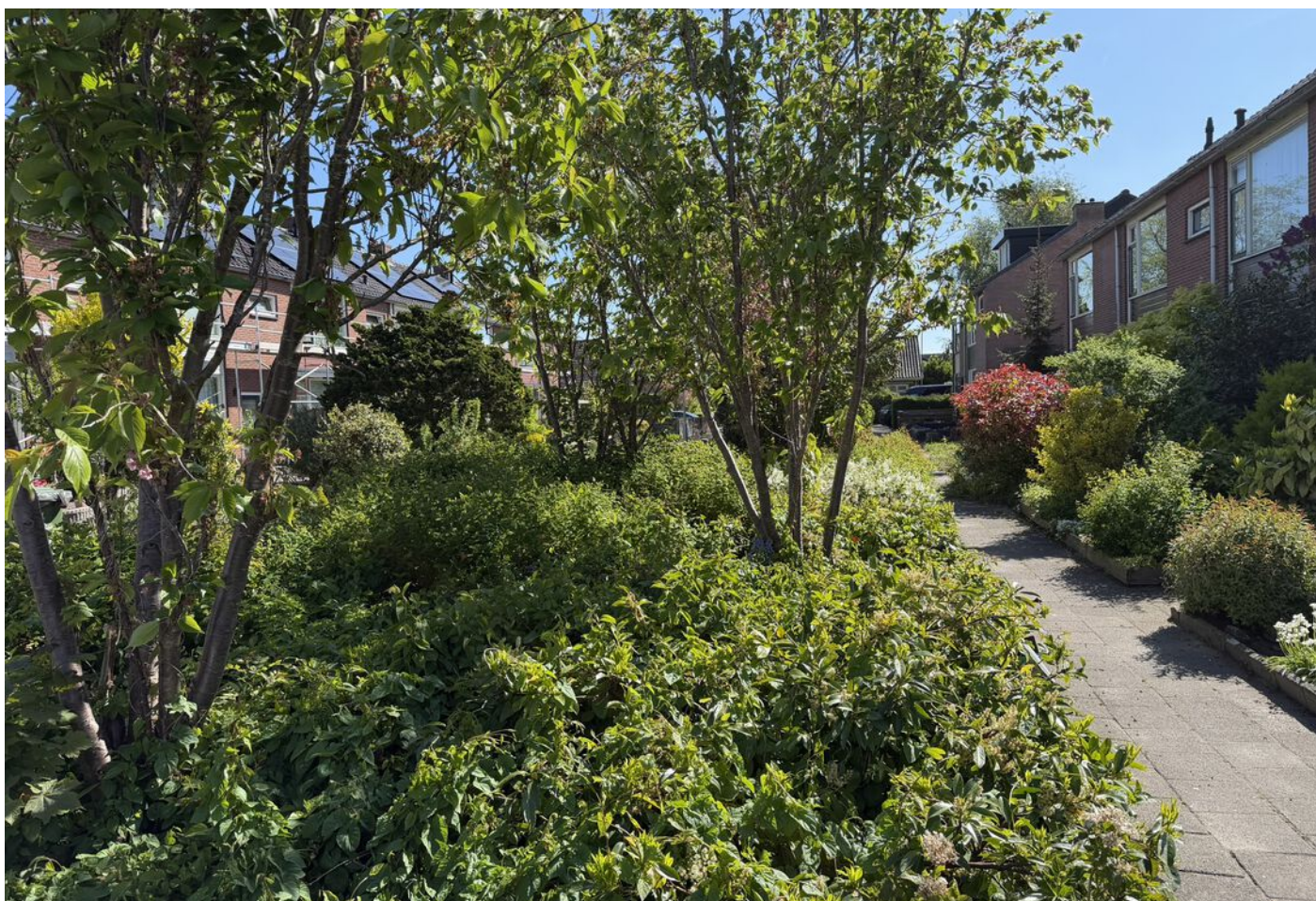
Oranje Nassaustraat 28, Bovenkarspel