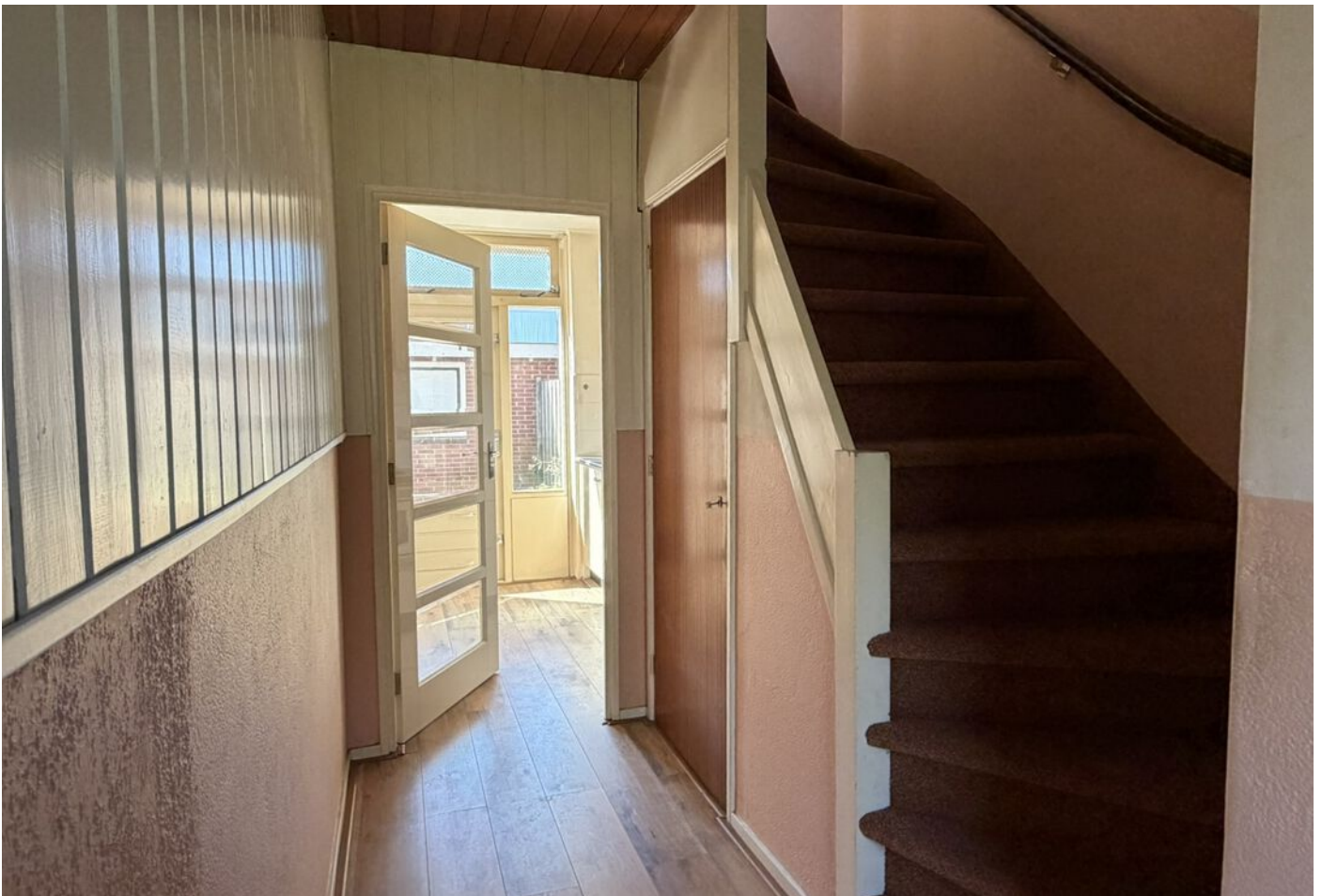
Oranje Nassaustraat 28, Bovenkarspel