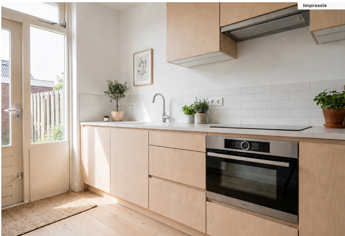
Oranje Nassaustraat 28, Bovenkarspel