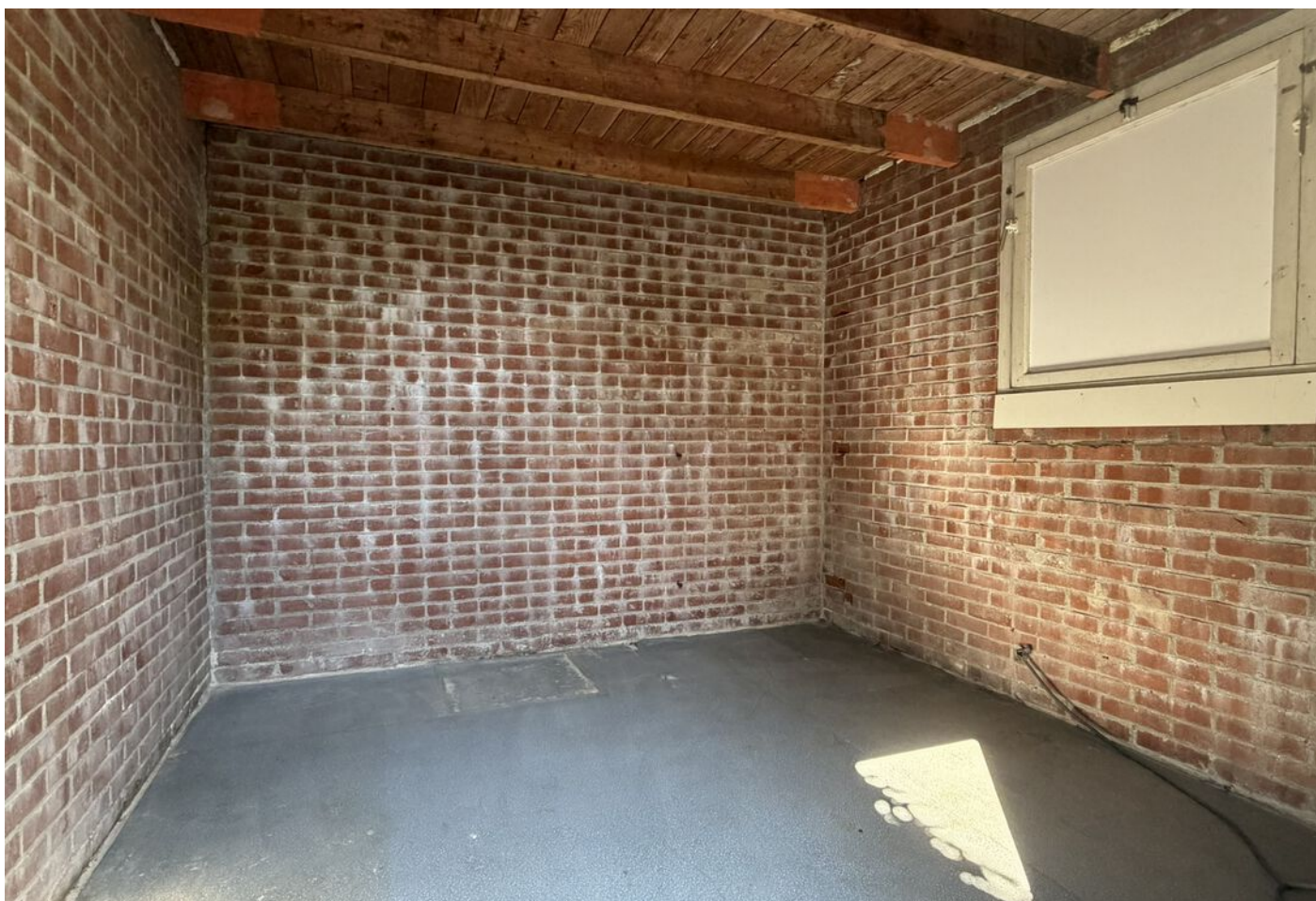
Oranje Nassaustraat 28, Bovenkarspel