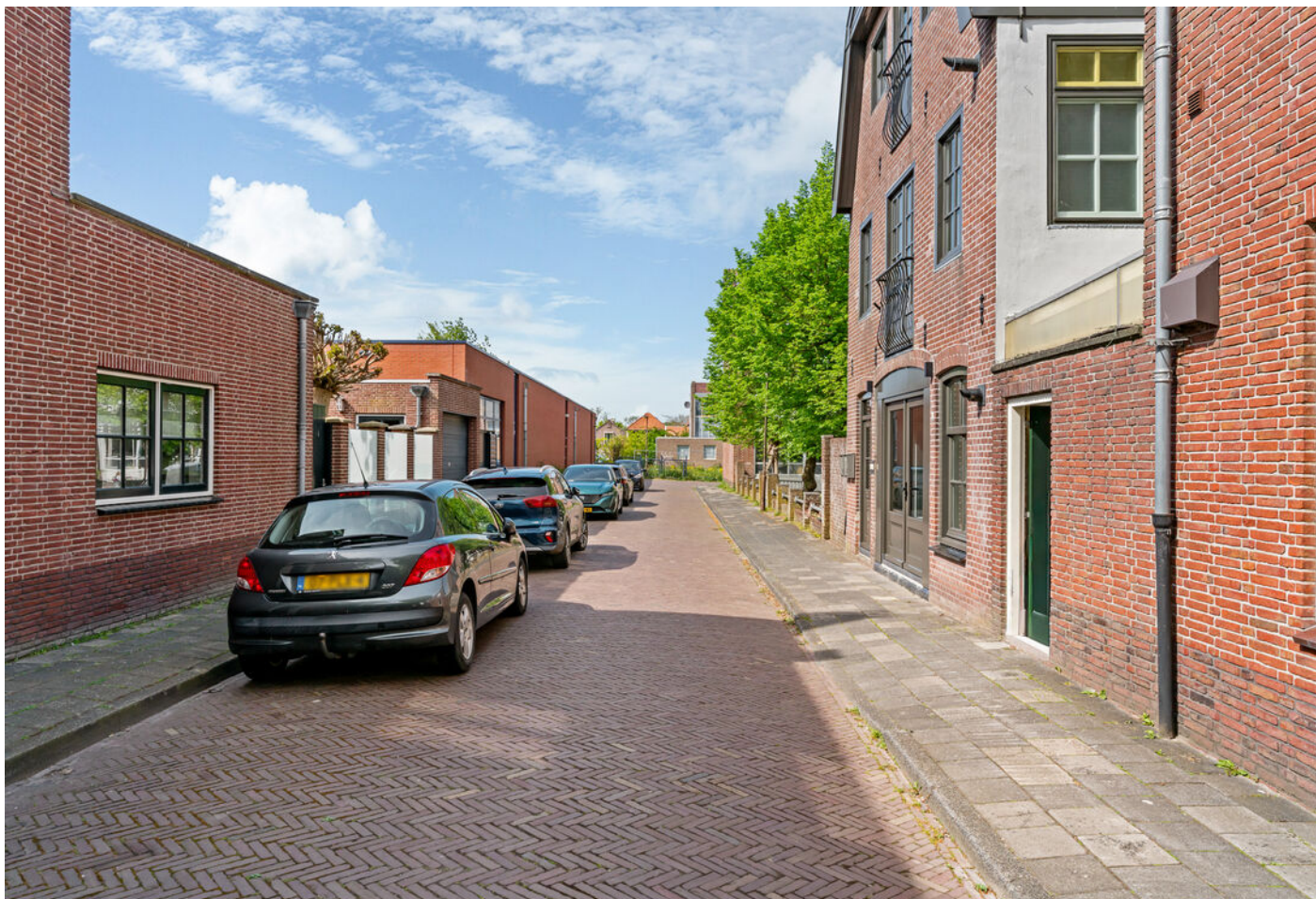
Raamstraat 4 a, Enkhuizen