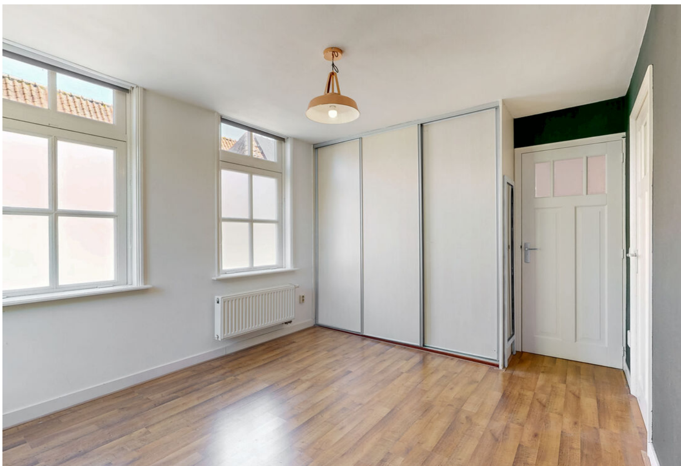
Raamstraat 4 a, Enkhuzen