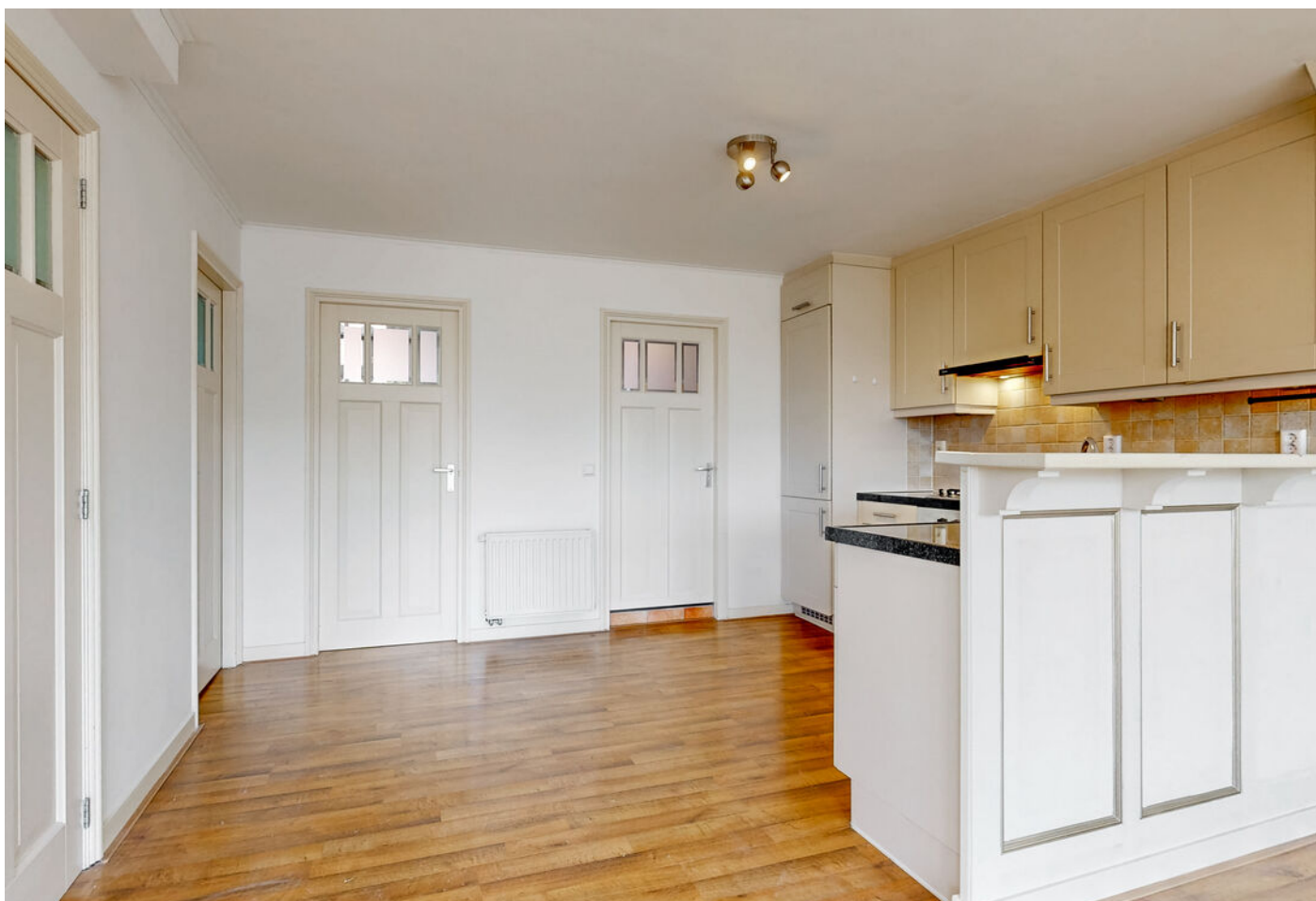
Raamstraat 4 a, Enkhuizen