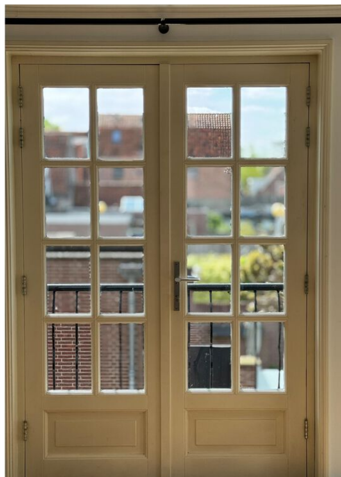
Raamstraat 4 a, Enkhuizen