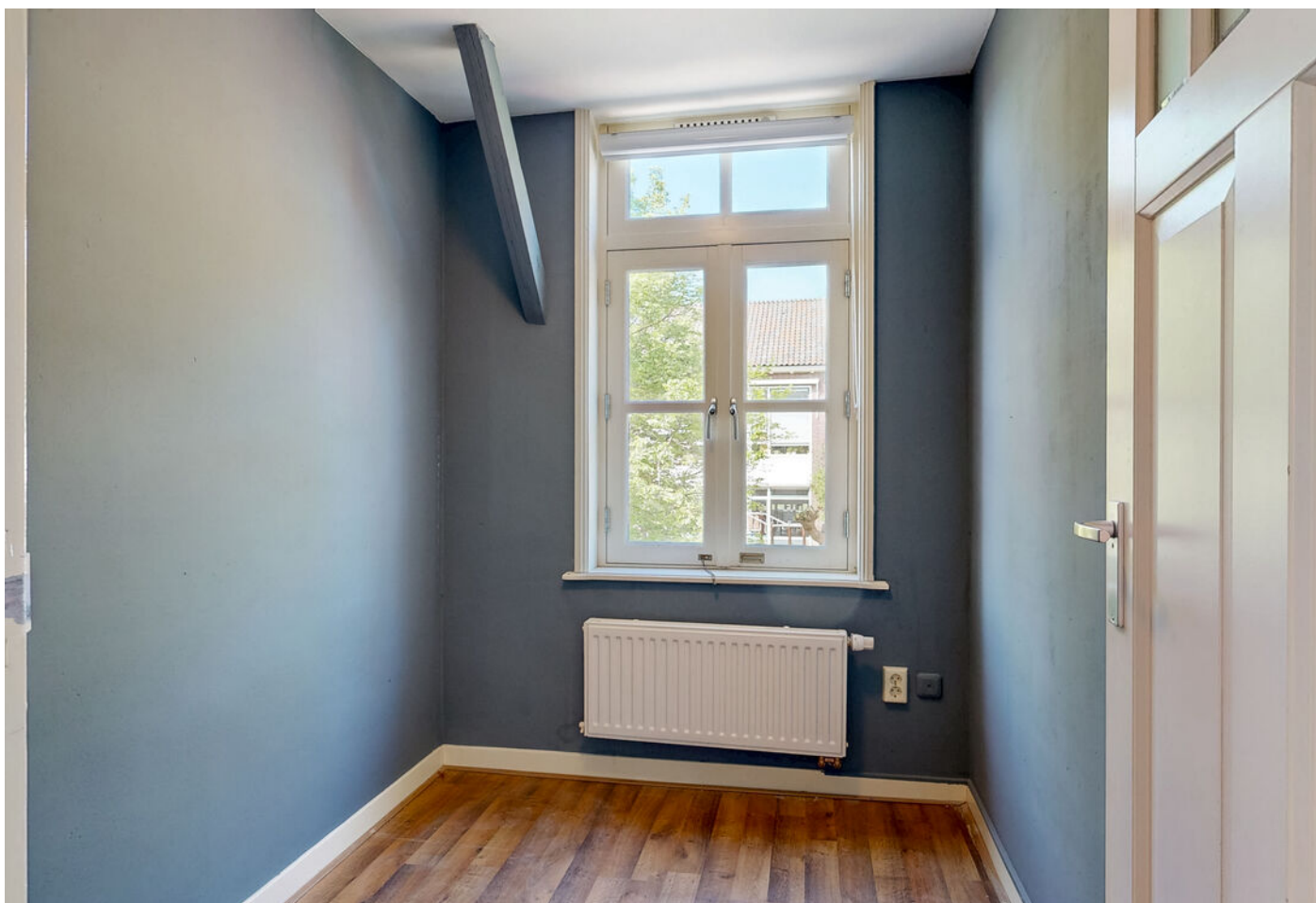
Raamstraat 4 a, Enkhuizen