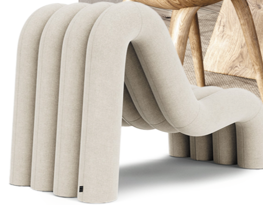
Fest Amsterdam Alp fauteuil