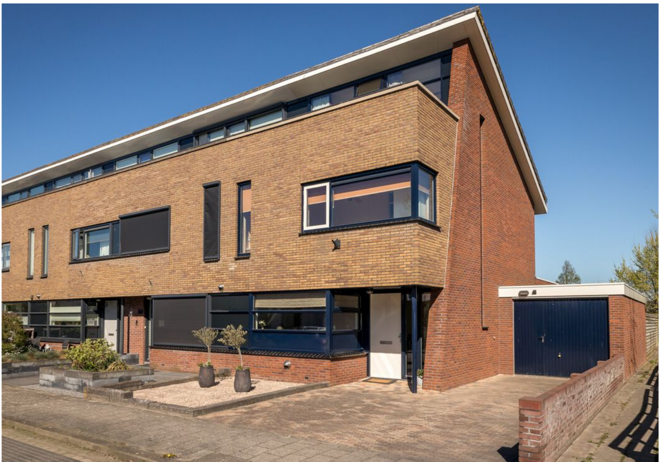
Dragon 19 HOOGKARSEL