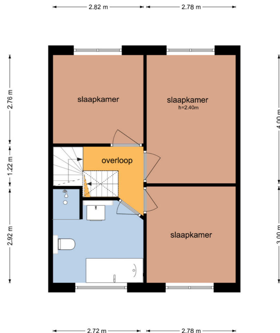
Zonnedauwstraat 19 - Assen Eerste Verdieping

De plattegronden zijn geproduceerd voor promotionele doeleinden en ter indicatie. Aan de plattegronden kunnen geen rechten worden ontleend