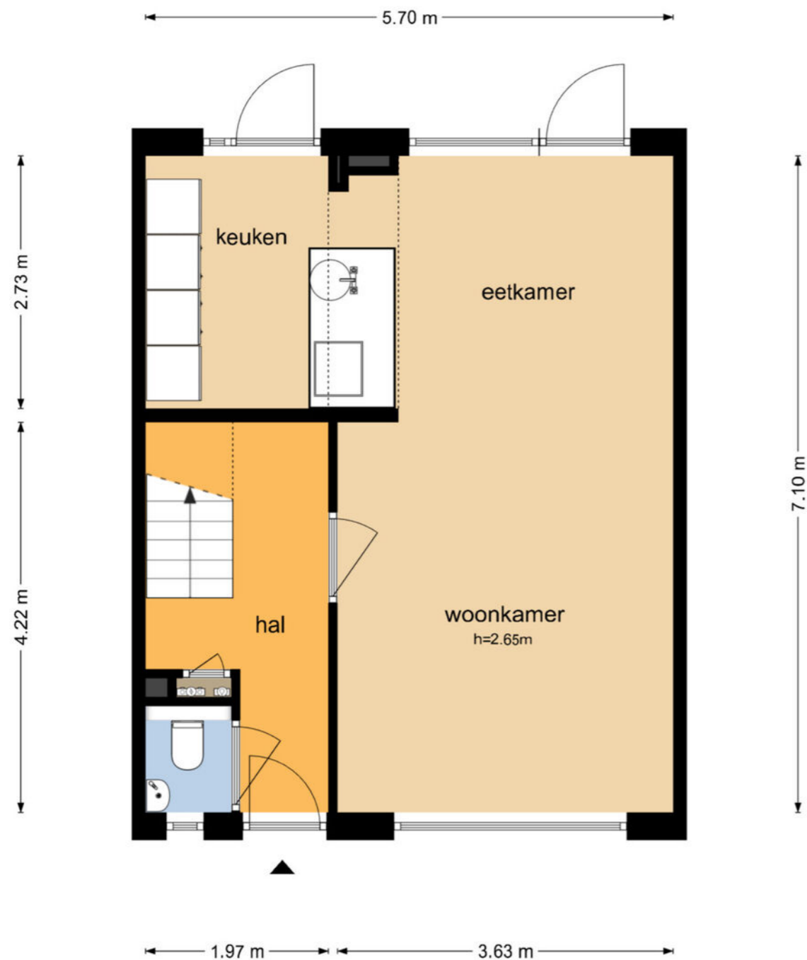
Zonnedauwstraat 19 - Assen Begane Grond

De plattegronden zijn geproduceerd voor promotionele doeleinden en ter indicatie. Aan de plattegronden kunnen geen rechten worden ontleend © www.objectenco.nl