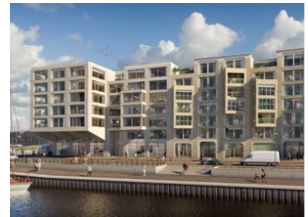
De Zuid – Scheveningen

MRP brengt als ontwikkelaar en investeerder werelden bij elkaar. We nemen u mee op reis om uiteindelijk op de door u gekozen bestemming te komen. Door verbindingen te leggen met mensen en plekken, creëren we gemeenschappen en levendige woon- en werkomgevingen. MRP streeft ernaar om inclusieve plekken te ontwikkelen waar verschillende mensen wonen, werken, met elkaar worden verbonden en gelukkig zijn.