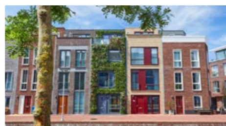
Groene Gevel – Delft