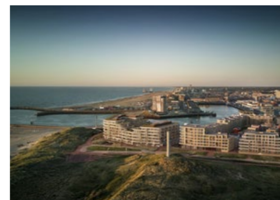
Mares – The Hague