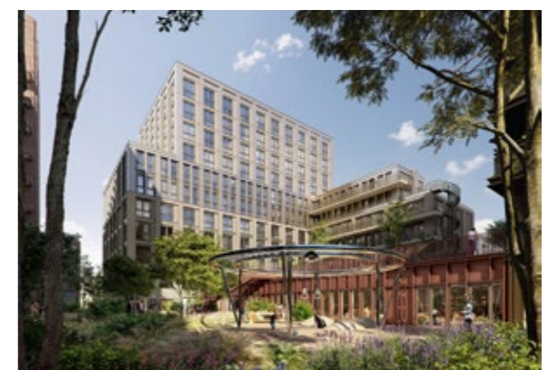
MIX – Amsterdam