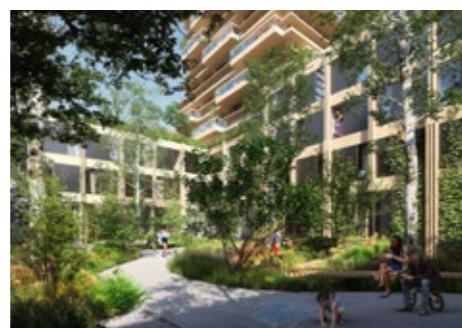
Horizons – Amsterdam

natuur, gezondheid, community, design & architectuur, duurzaamheid en de circulaire economie. Wij zijn ervan overtuigd dat deze elementen de bouwstenen vormen van toekomstbestendige woon-, werk- en leefomgevingen. Krachtig en energiek werken we aan een volhoudbare leefomgeving waar wij de stip steeds voorbij de horizon leggen.