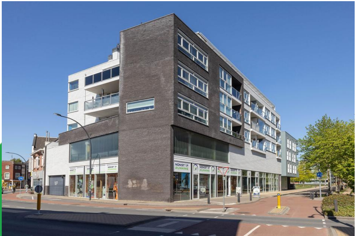
Bevrijderslaantje 19, 7551 KV Hengelo