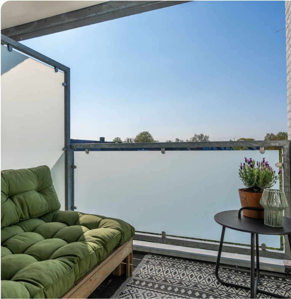
balkon met uitzicht