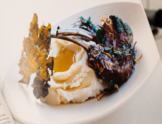
lamskoteletten met wijtbladen en chaz

Snijdt overmatig vet van de koteletten en hetroo hie kanten met wat peper en zout. Verhit een gte kookvetten op halfhoog tot hoog vuur. Doe de citroenschi en oregano in de pan en bak 30 seconden Ving de koteletten toe en bak ze 3 minuten aan elke of tot de gewenste gaarheid. Haal ze de pan en zet Verhit de extra olie in de pan en bak de wijtbladen 2 minuten aan elke kant of tot ze kinnak zijn. Smeer de koteletten met aarsoepoerme met wat dijfolie en zeezout en leg er een wijtblad oed. Voor 4 personen. * Gebruik ingemaakte wijtbladen die in alvied of ma wijtbladen die wat zachter gemaakt zijn in kaent oie Goed dringen voor het bakken.