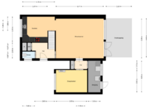
Indeling begane grond