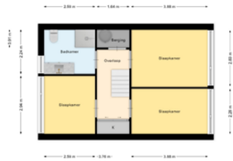
Indeling 1 ste verdieping