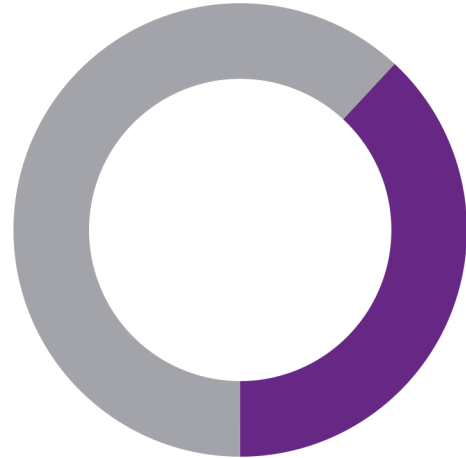
Koop / huur

0 - 14: 15% 15 - 24: 14% 25 - 44: 28% 45 - 64: 24% 65+: 19%