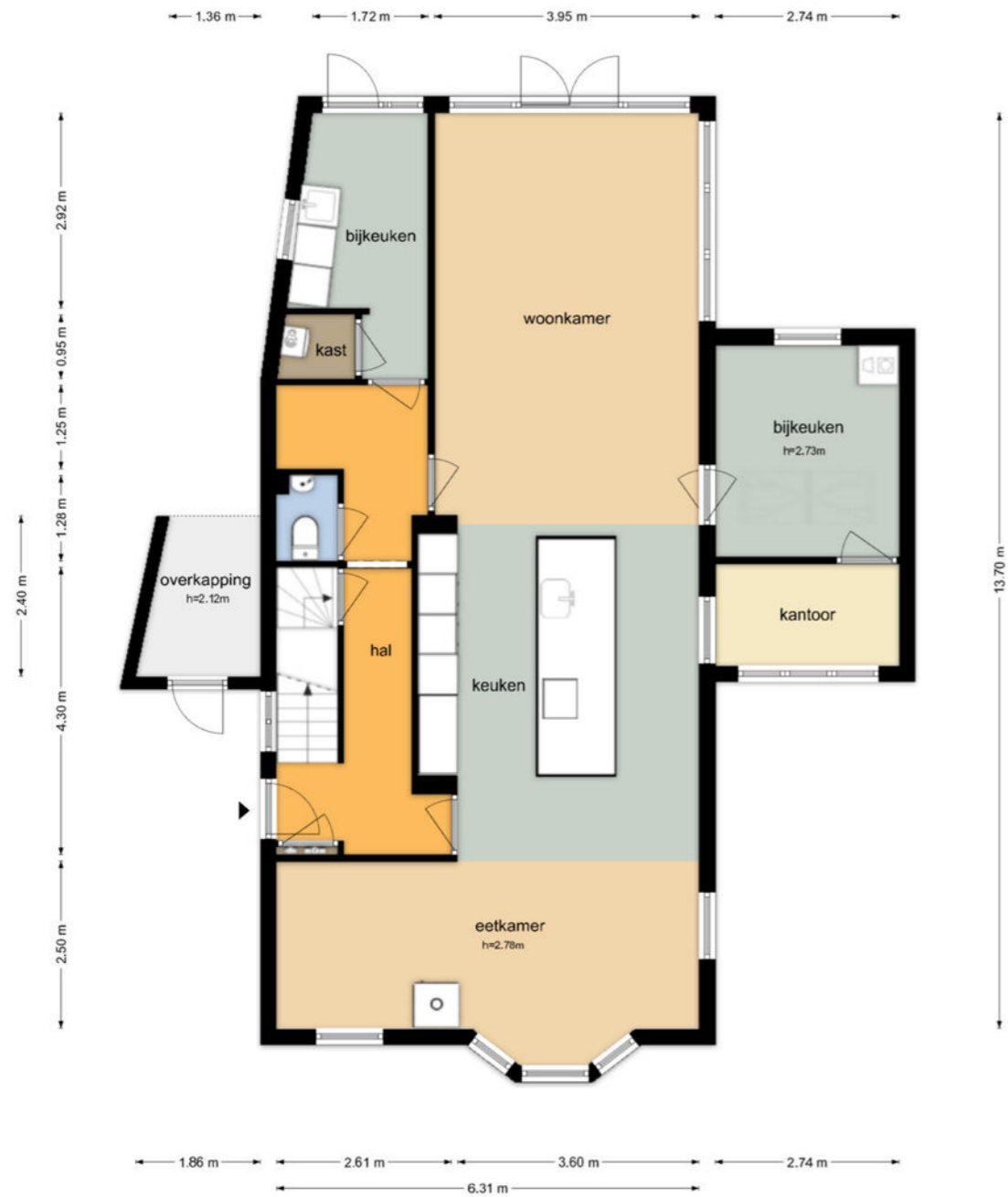
Anreperstraat 34 - Assen Begane Grond

De plattegronden zijn geproduceerd voor promotionele doeleinden en ter indicatie. Aan de plattegronden kunnen geen rechten worden ontleend.