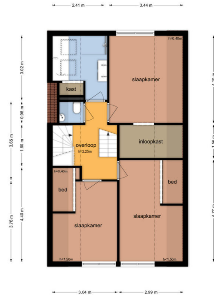
Anreperstraat 34 - Assen Eerste Verdieping

De plattegronden zijn geproduceerd voor promotionele doeleinden en ter indicatie. Aan de plattegronden kunnen geen rechten worden ontleend.