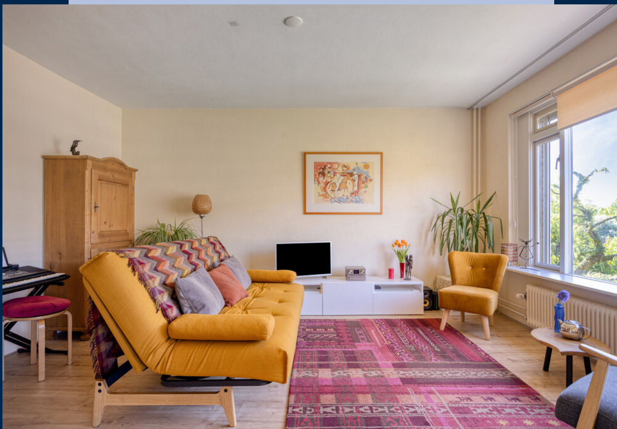
De lichte woonkamer is v.v. van een laminaatvloer en staat in open verbinding met de eetkamer, die toegang geeft tot het balkon.