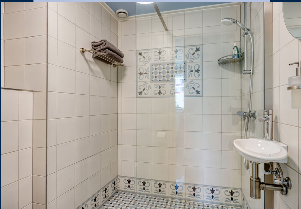
De vernieuwde badkamer (2022) is voorzien van een inloopdouche, wastafel en toilet.