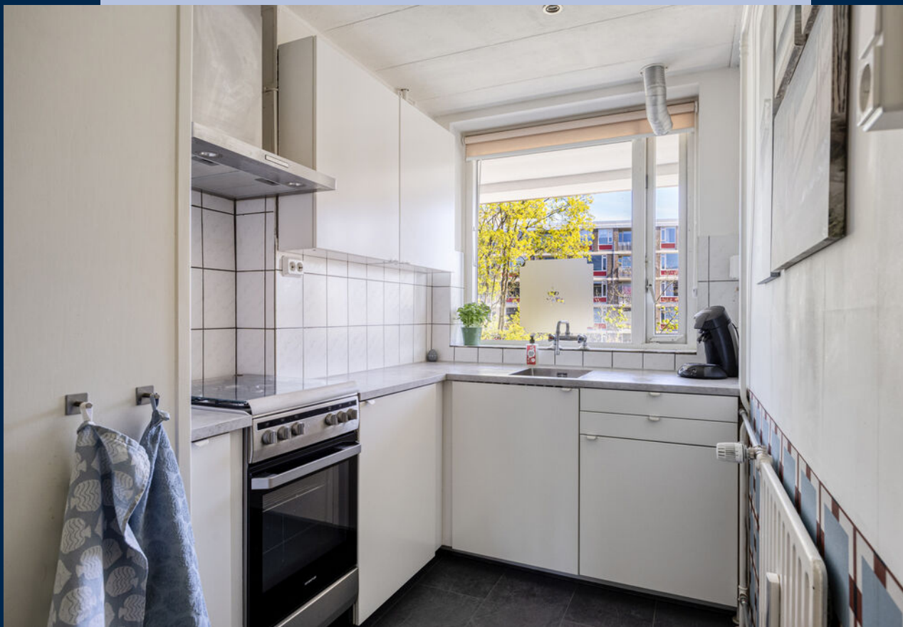
De keuken is praktisch ingericht en voorzien van diverse inbouwapparatuur.