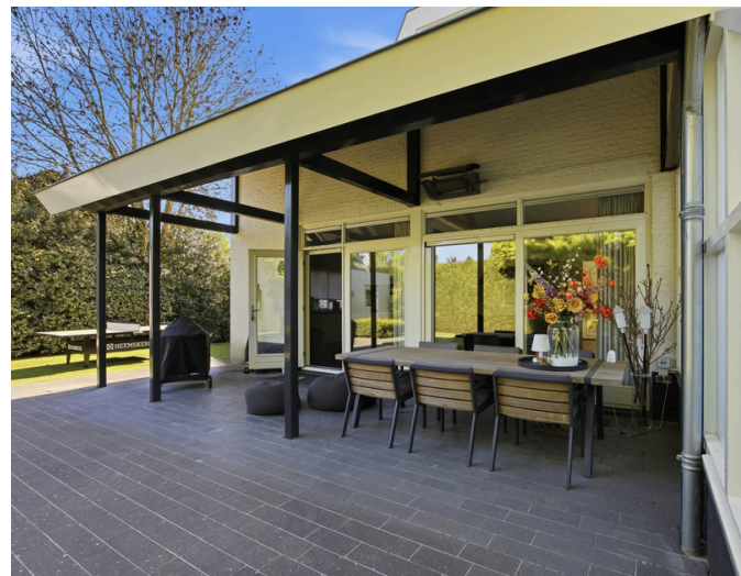
Pijperhof 1 - Raamsdonksveer