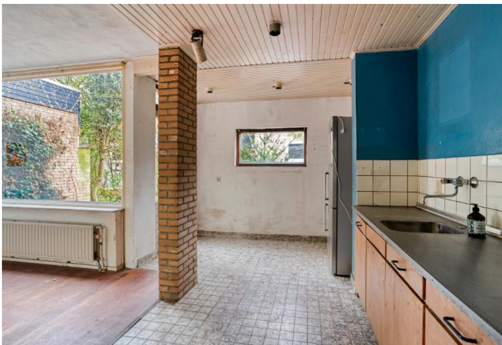
Will Klerkx Makelaardij