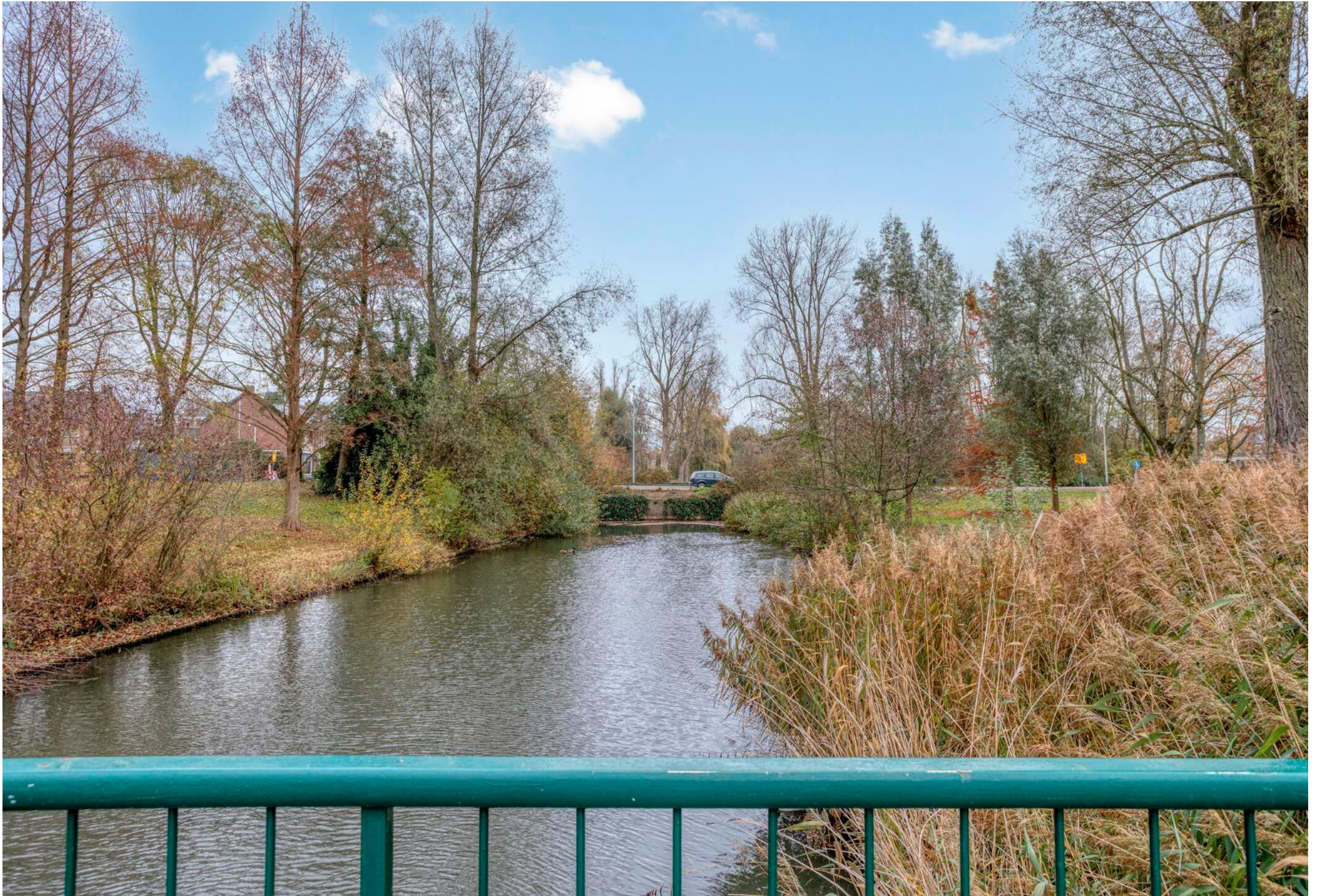
Will Klerkx Makelaardij