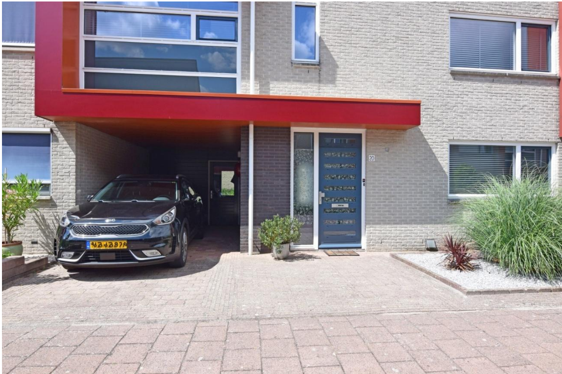
Hooihark 20 te Soest