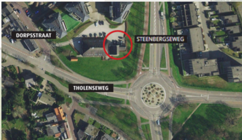
Ons kantoor bevindt zich in het woonhuis van boerderij 't Lindeke in Halsteren.