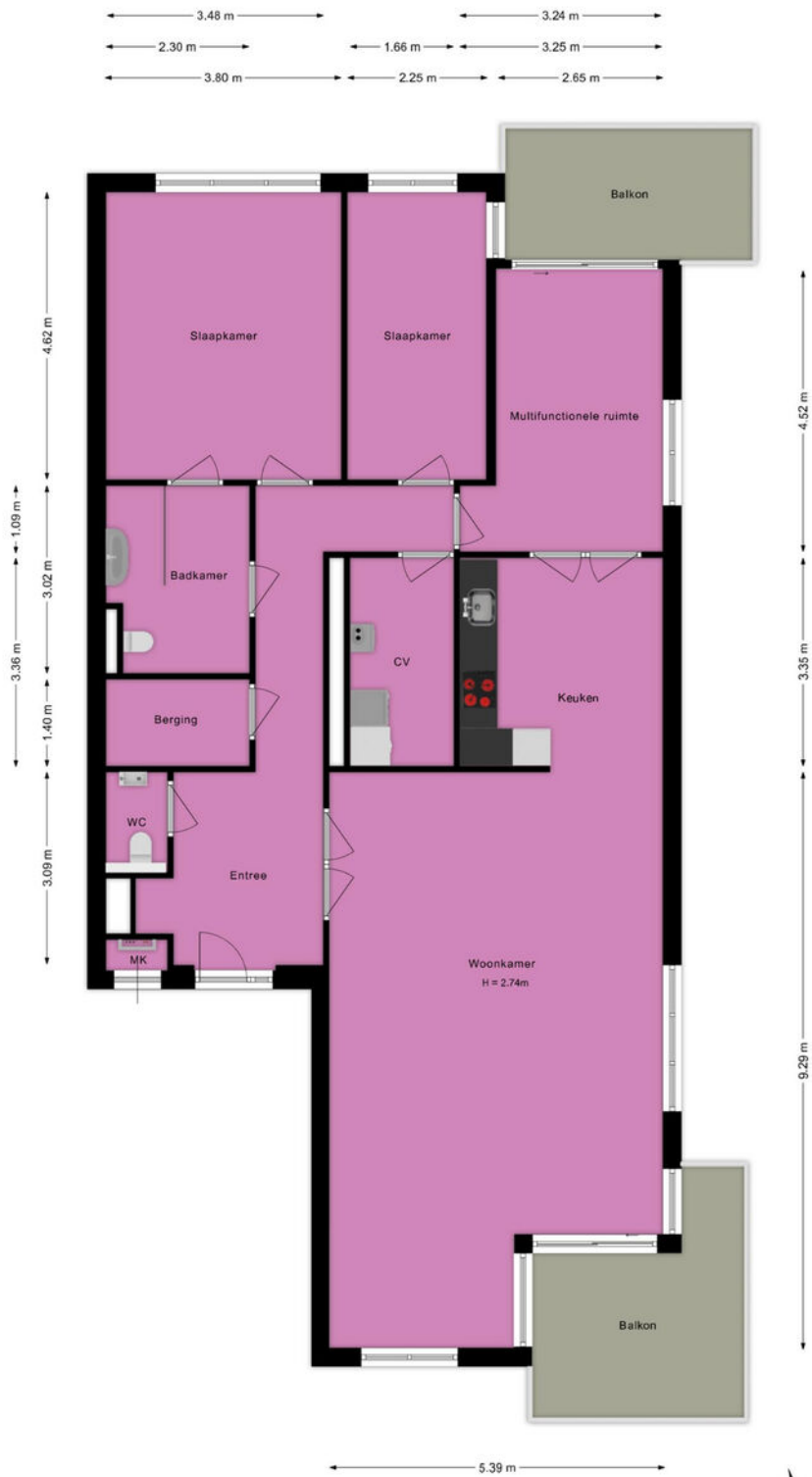
Floris Versterstraat 22 Rijnsburg Appartement

Deze plattegrond is met de grootst mogelijke zorg samengesteld. Desondanks kunnen er geen rechten aan worden ontleend en kunnen er kleine afwijking zijn in de exacte maatvoering. www.agvastgoedmedia.nl