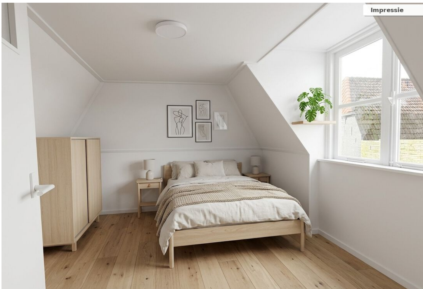
Kruisstraat 16, Medemblik