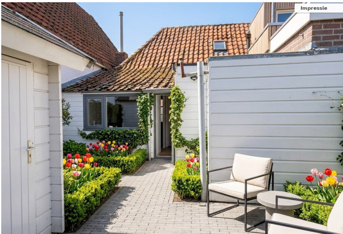
Kruisstraat 16, Medemblik