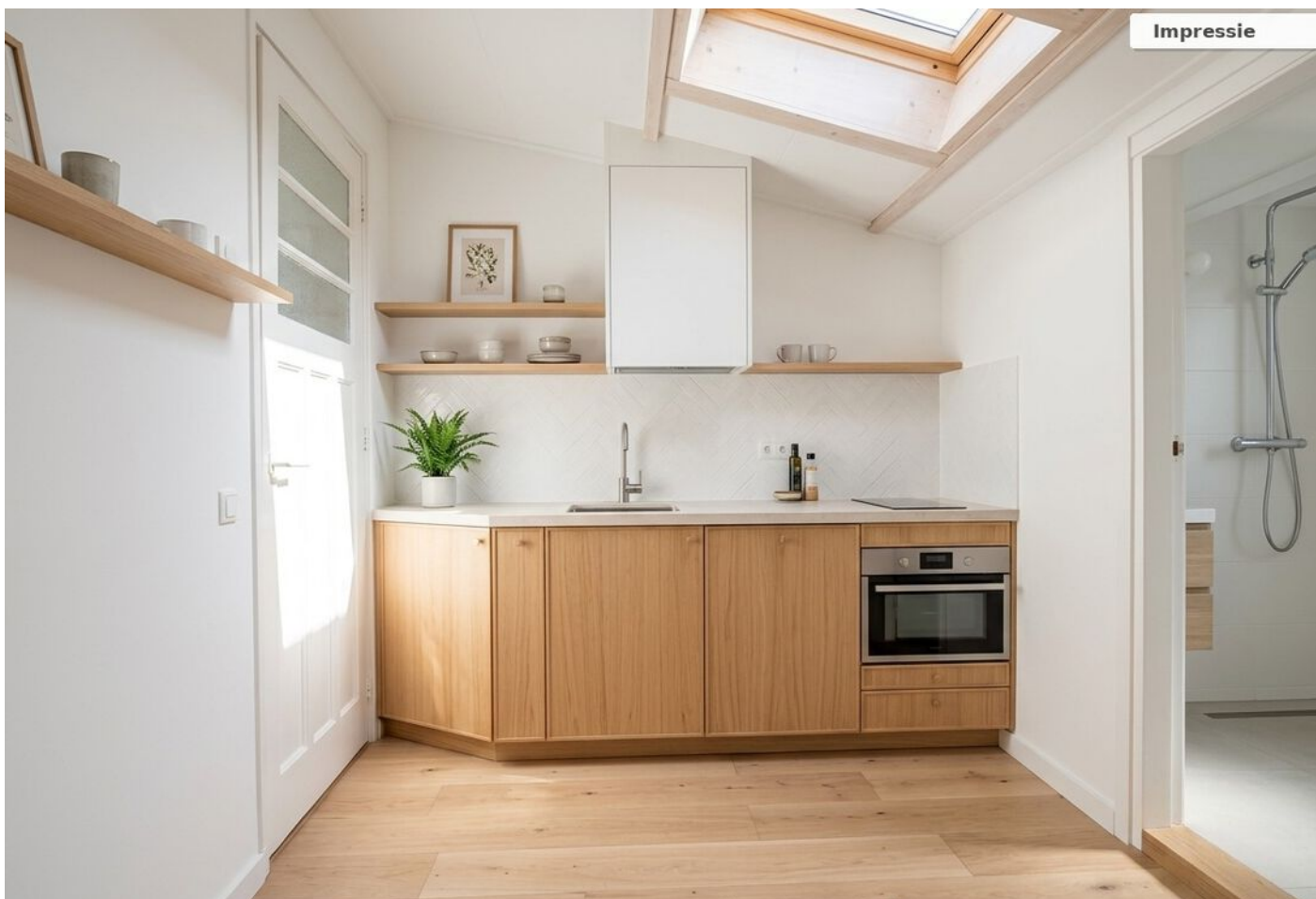
Kruisstraat 16, Medemblik