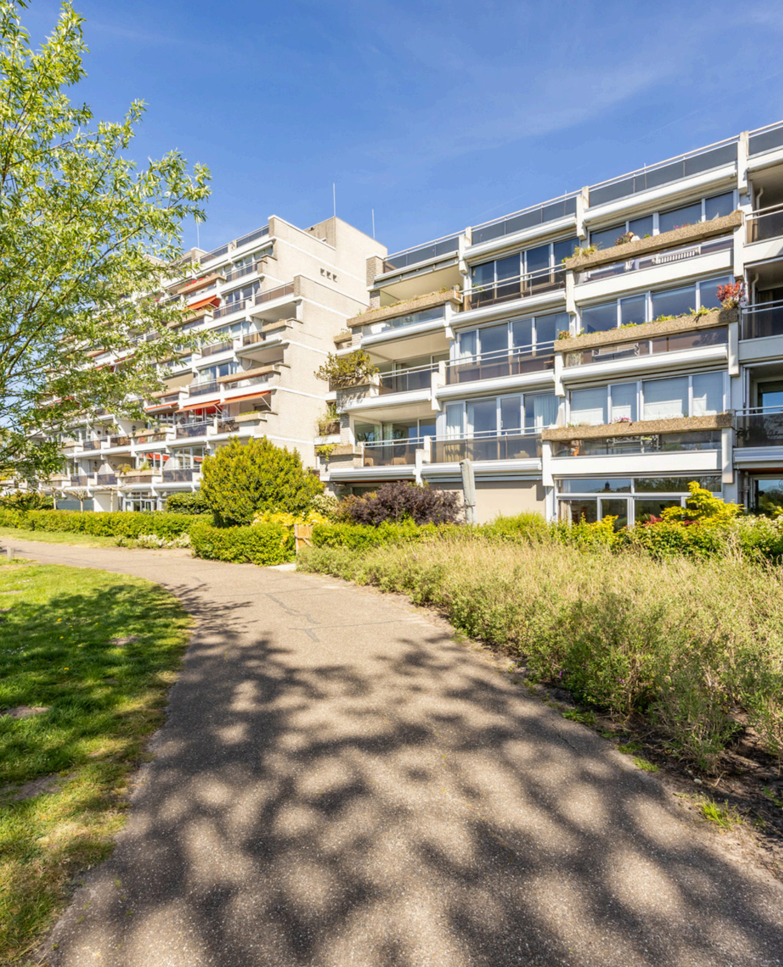
Bartoklaan 55, Heemstede