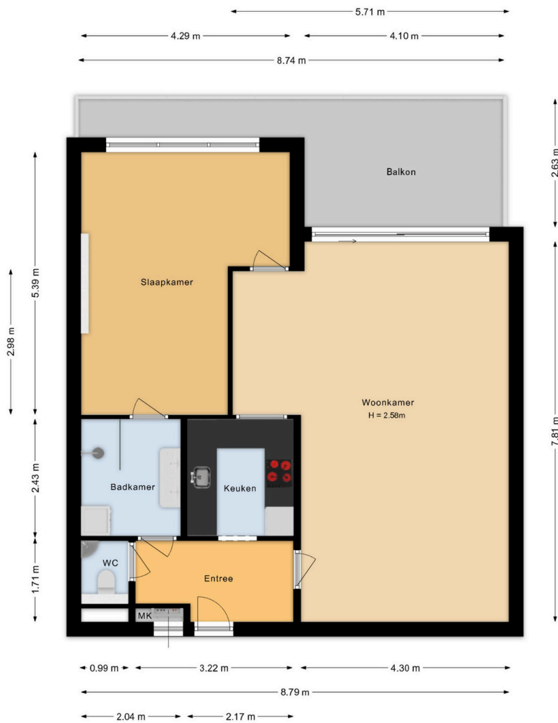
Bartoklaan 55 Heemstede 2e Verdieping

Deze plattegrond is met de grootst mogelijke zorg samengesteld. Desondanks kunnen er geen rechten aan worden ontleend en kunnen er kleine afwijking zijn in de exacte maatvoering. www.agvastgoedmedia.nl