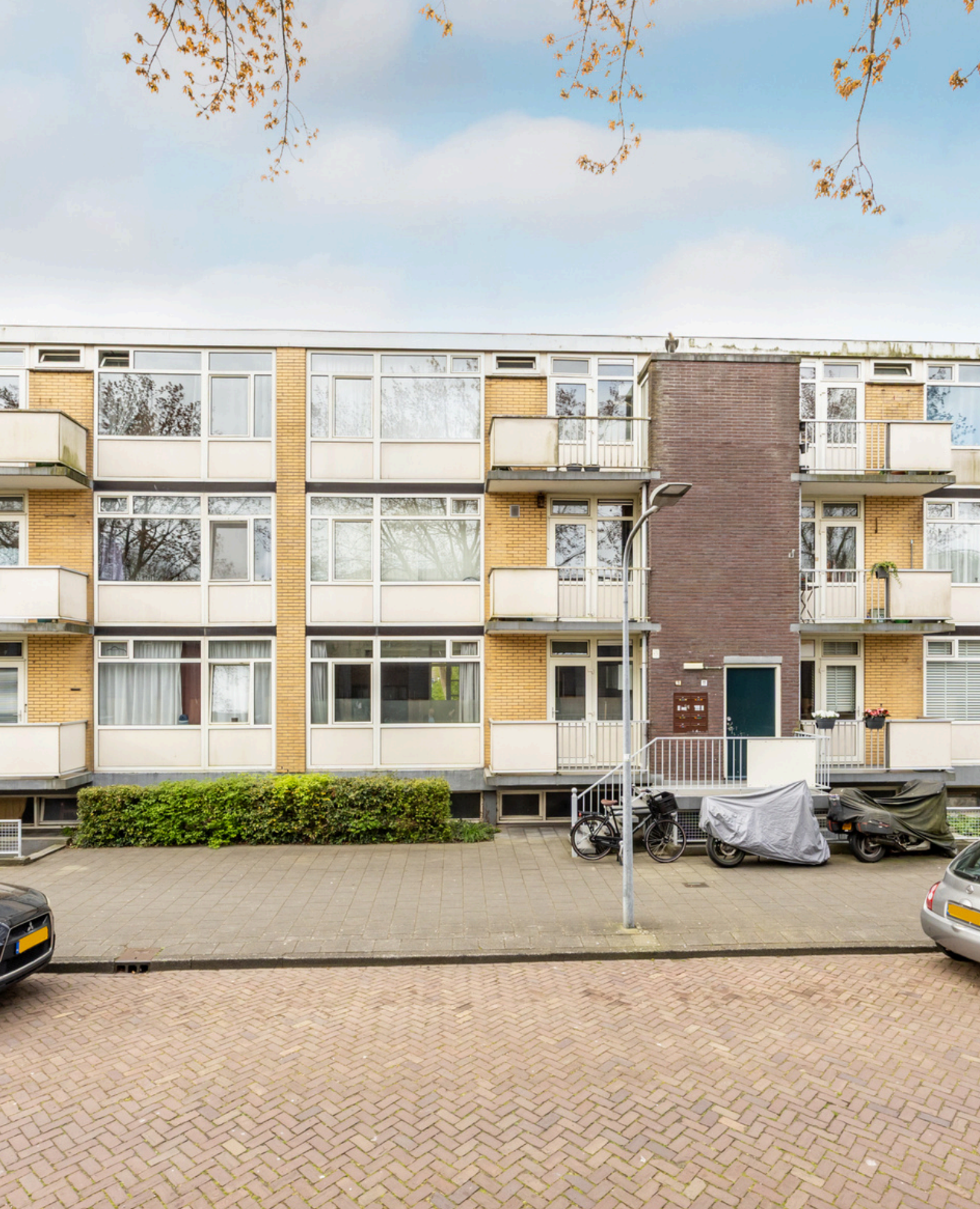
Albert Verwey laan 9, Haarlem