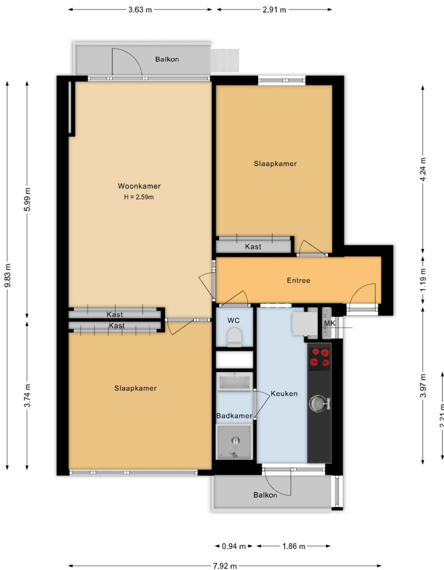
Albert Verweylaan 9 hs Haarlem Appartement

Deze plattegrond is met de grootst mogelijke zorg samengesteld. Desondanks kunnen er geen rechten aan worden ontleend en kunnen er kleine afwijking zijn in de exacte maatvoering. www.agvastgoedmedia.nl