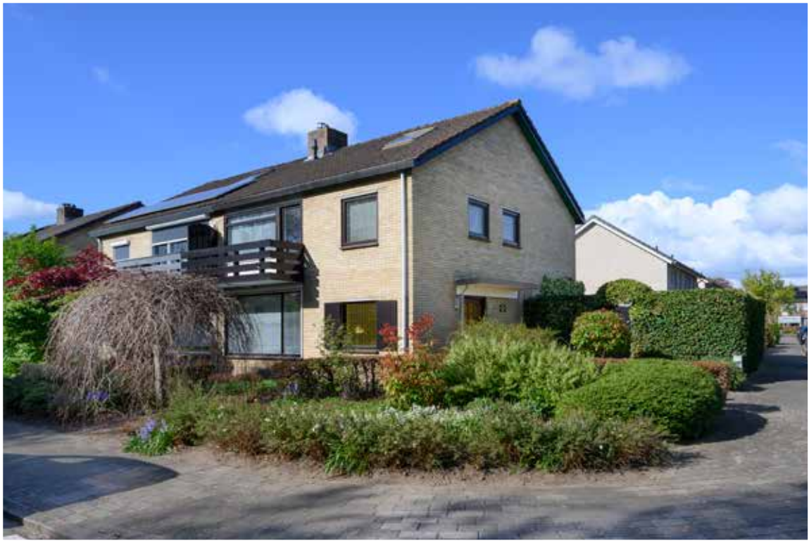
Brummen Geelgorsstraat 18